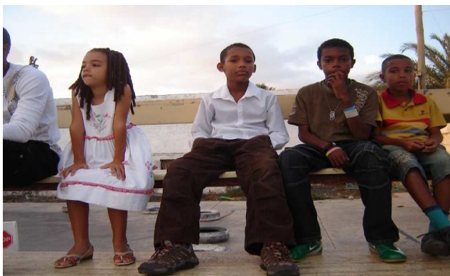
A Etnia diferenciada explícita em Crianças típicas de Cabo-Verdiana

Nesta sequência, passeando por mares nunca antes navegados, cerca de 1460 um qualquer seu escudeiro avistou ou tropeçou com o ainda desabitado arquipélago a que chamou de ilhas de Cabo Verde, começando a colonizá-las por intermédio de Capitánias Hereditárias 2 anos mais tarde, trazendo escravos africanos para plantar algodão, árvores de fruto e cana-de-açúcar.