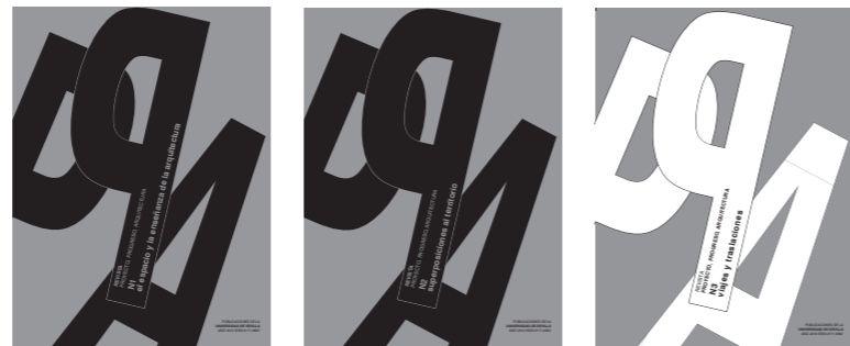
PPA N01 PPA N02 PPA N03