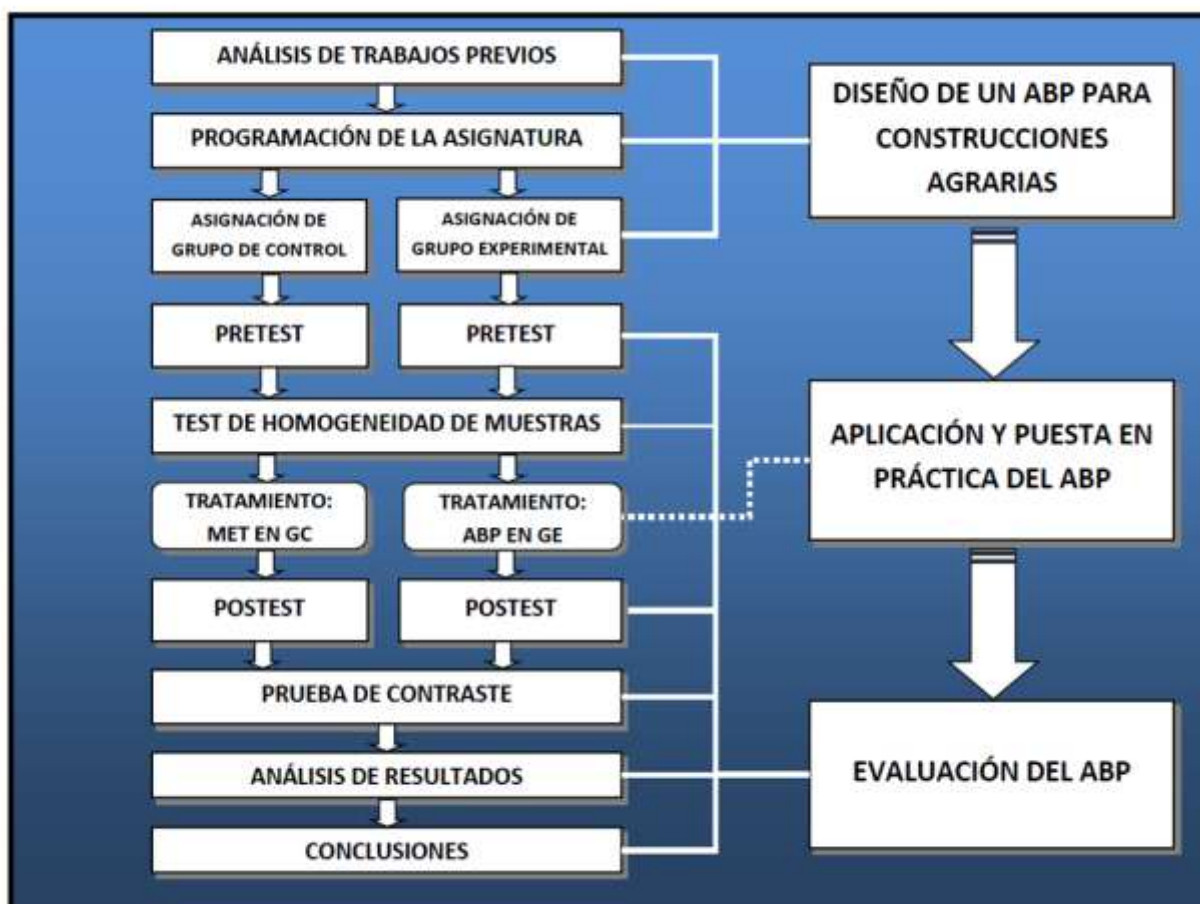
Fig.1. Fases y Operaciones de la Investigación.

En cuanto al número de alumnos implicados en la investigación, han sido en total 52. Es un número de alumnos adecuado a los medios docentes disponibles y a la atención en detalle que requiere un auténtico ABP. No todos los alumnos que han cursado la asignatura han participado de los grupos objeto de evaluación, existiendo un porcentaje en torno a un 10% (habitualmente repetidores de la asignatura) que no asistieron regularmente a clase, quedando eliminados de las pruebas correspondientes. El tamaño de cada grupo se fijó en 26 alumnos. El total de matriculados en la asignatura ha ascendido a 60 alumnos para el curso 2015-16.