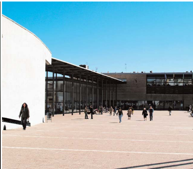
📍 Biblioteca y Ayuntamiento (1992) en Camas (Sevilla) / IGNACIO CAPILLA RONCERO

te, con una importante dosis de movimiento, genera multitud de puntos de vista donde la sorpresa y la variedad son las constantes. Un lugar plástico y maleable que tensiona al máximo la manera de percibir lo interno y lo externo. Un interior que sólo produce el exterior del edificio como revés, ambigüedad característica de cualquier paisaje.