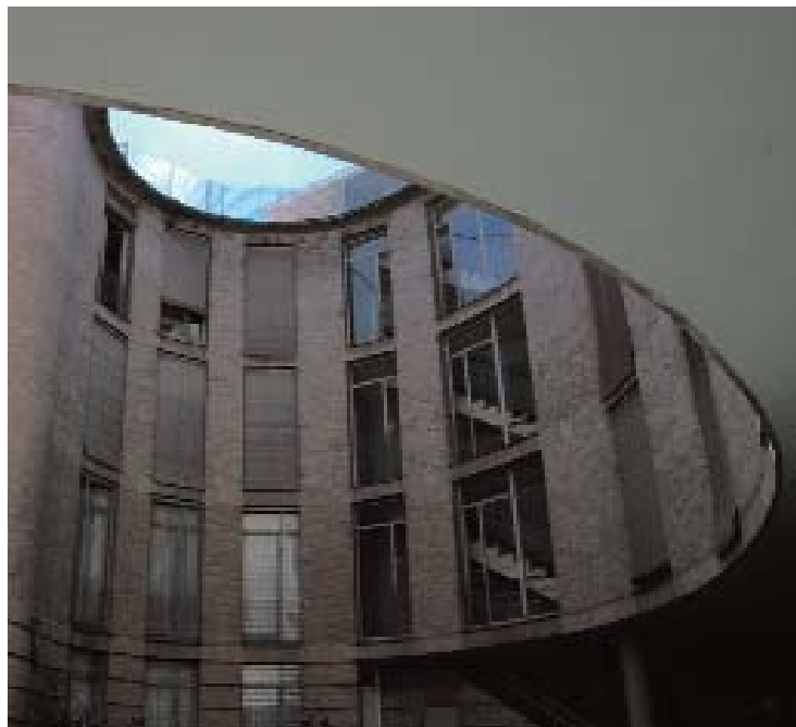
📍 Viviendas en calle Doña María Coronel (1976) Sevilla / SANTIAGO QUESADA