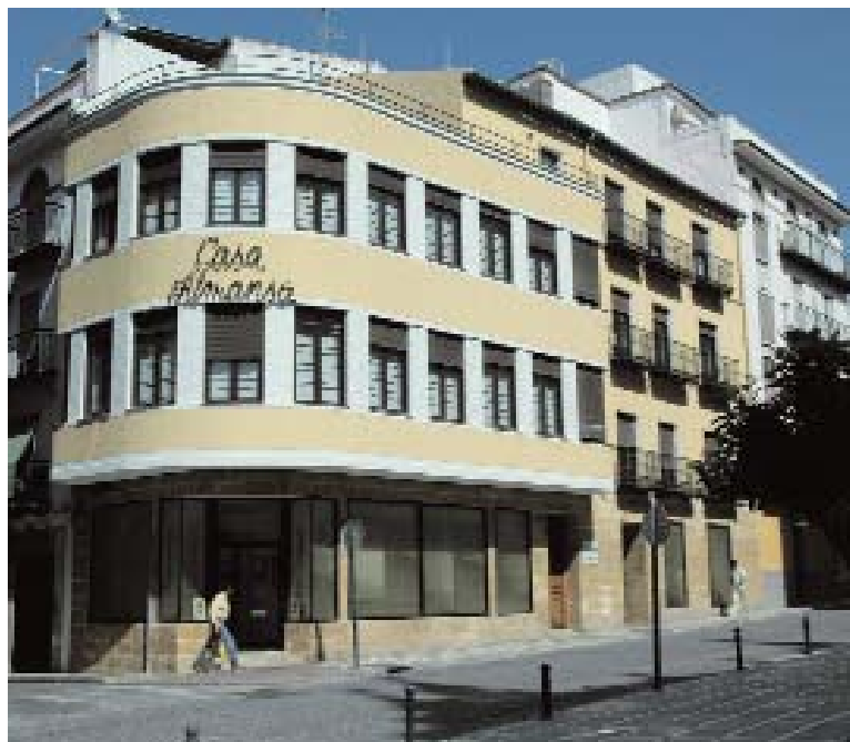
📍 Casa Almansa (1930) en Jaén / SANTIAGO QUESADA