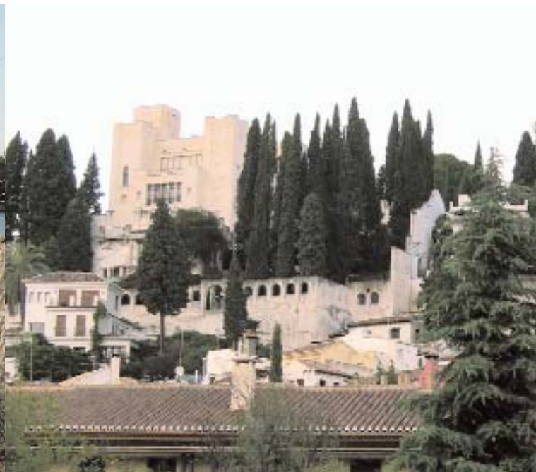
📍 Carmen de la Fundación Rodríguez Acosta (1928) en Granada

en su conjunto, definen un sistema estético con consistencia en un tiempo y una geografía determinados.