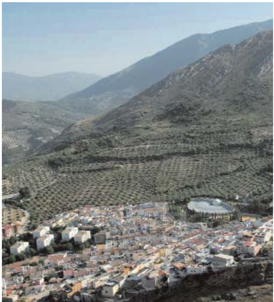
📍 Paraje de la Mella en Jaén, a la izquierda grupo de cien viviendas sociales (1958) / SANTIAGO QUESADA

La anterior es una de las impresiones que aportan, a la retina o a la mente, algunas cualidades o factores que dibujan un boceto donde se comienza a percibir cierto paisaje como marco cultural de referencia. Va apareciendo un rico paisaje -algo desconocido, nada homogéneo y en constante mutación- del que surgen las obras de arquitectura producidas durante el pasado siglo en Andalucía. Edificios que componen un paisaje con diferentes intensidades y grados de coherencia pero que,