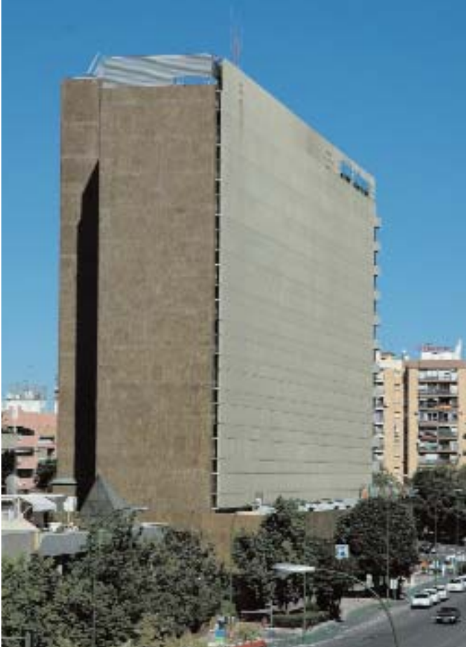
📍 Hotel Los Lebreros (1973) en Sevilla / SANTIAGO QUESADA