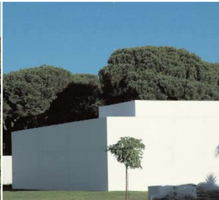
📍 Casa Gaspar (1992) en Zahara (Cádiz) / SANTIAGO QUESADA