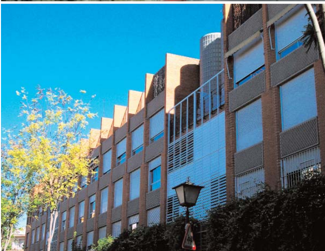
📍 Manzana de viviendas en El Porvenir (Sevilla), obra realizada en 1979 / AMADEO RAMOS CARRANZA