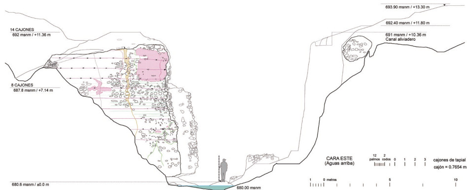
Fig. 6- Sección transversal, aguas arriba, del desfiladero o garganta del Ciervo, representando los restos del estribo izquierdo, la base del derecho y el posible canal aliviadero del embalse. Elaboración propia.

sobrantes del riego drenarían al cercano arroyo Claudio y también al río Orcera (Fig. 7).