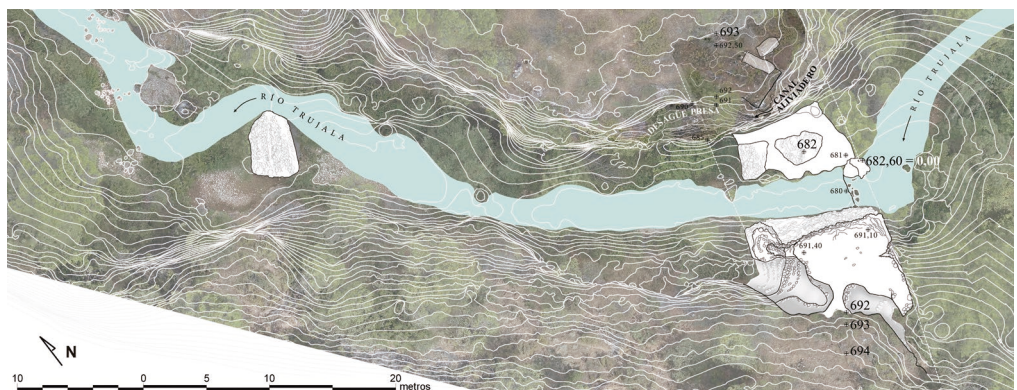
Fig. 3- Cauce del río Trujala a su paso por el desfiladero del Ciervo. Se representan los restos de los dos estribos y los fragmentos existentes a cuarenta metros del dique. Elaboración propia.

El curso del río Trujala entra en el desfiladero, en dirección sureste-noroeste, a la cota 680 m.s.n.m. Al taponar en ese punto el paso del agua se consiguió elevar el nivel de agua de 12 a 13 metros y formar el embalse. Esta nueva altura permitió que el agua alcanzara una vaguada