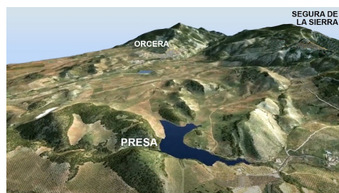
Fig. 4- Reconstrucción tridimensional del paisaje del embalse de la Albuhera. Elaboración propia.