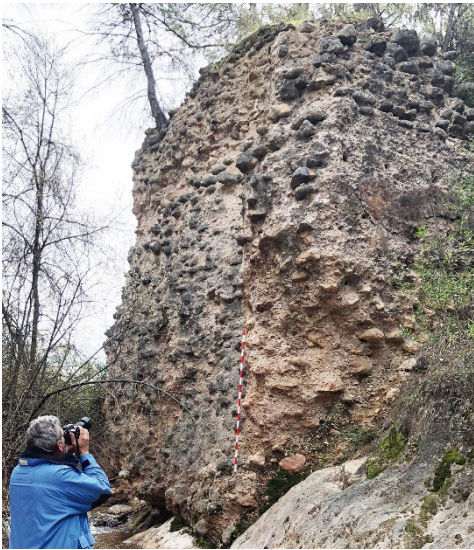
Fig. 1- Vista, aguas abajo, del estribo izquierdo de la presa. Elaboración propia.

No hay demasiados ejemplos de levantamientos de este tipo de infraestructuras medievales, por lo que el estudio, análisis gráfico e interpretación, de uno de los pocos casos que todavía se conservan, es especialmente relevante para el avance del conocimiento en la ingeniería hidráulica andalusí. El paisaje y los vestigios que aún permanecen son una importante fuente de información primaria, complementaria a las fuentes escritas. Los dos estribos, los terrenos del antiguo embalse o las tierras irrigadas por el mismo, aportan una valiosa información, útil para conocer cómo eran estos sistemas hidráulicos de irrigación (Fig. 1).