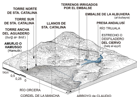
Fig. 7- Terrenos irrigados quizá pertenecientes al posible rafal de Hamuš̄k. Elaboración propia.

La construcción del embalse de la Albuera fue iniciativa de un poder local, es decir de un gobernante andalusí, anterior a la administración almohade del territorio y fue expresión de una necesidad funcional. Su sentido habría sido construir un almacenamiento de agua para irrigar terrenos de un campo ubicado en el valle de los ríos Hornos y Trujala. Esta infraestructura hidráulica habría formado parte de un proceso de colonización agrícola basado en un modelo específico de fincas privadas, caracterizadas por albergar una reserva hídrica de notables dimensiones. El pequeño mar o albuera habría servido para regar los terrenos de un posible rafal existente en Amurjo o Hamusgo, cuyo propietario pudo haber sido Ibn Hamuš̄k.