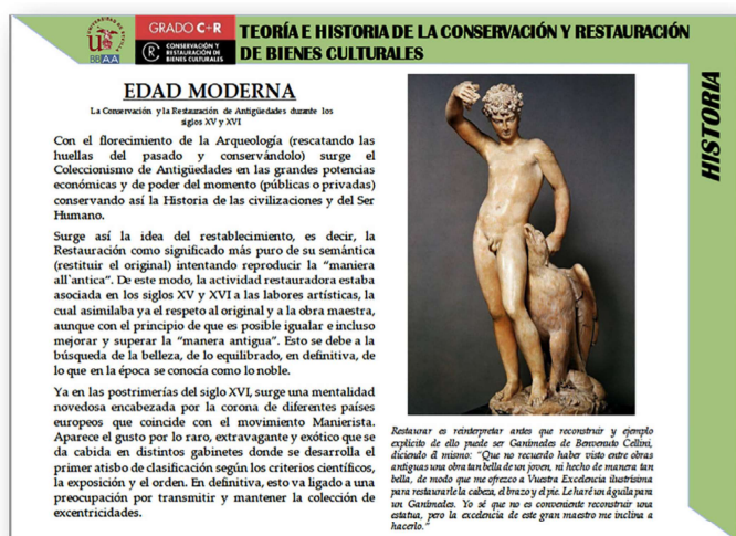
Fig. 1 Ficha Edad Moderna