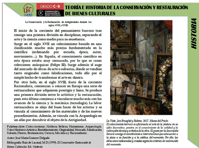
Fig. 2 Ficha Edad Moderna