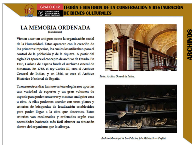
Fig. 4 Ficha: la memoria ordenada