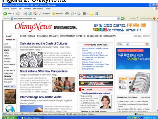
Figura 2: OhMyNews .

dólares por cada texto publicado. El sostén de la estrategia parece ser la conexión entre las tres puntas de la producción de noticias en OhMyNews : los ciudadanos, los periodistas y los editores. La rentabilidad del negocio viene de la publicidad (70% de sus ingresos), de la distribución de noticias a otros medios (20%) y, lo demás, del pago de asociados. El weblog Estoestucuman asegura que el cibermedio surcoreano “comienza a tener beneficios gracias a una facturación publicitaria de medio millón de dólares” ( www.estoestucuman.com.ar ) 19 . Los responsables del weblog son taxativos, después de enumeraren otras iniciativas del tipo, afirmando que “el negocio del periodismo participativo avanza”.