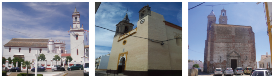
Figura 2: Parroquia de San Pablo, Aznalcázar; Parroquia de Nuestra Señora de la Granada, La Puebla del Río; Parroquia de San Juan Bautista, El Castillo de las Guardas. 24/07/2014.

rentes, con la particularidad común de desarrollar actividad religiosa en su interior, además de otras singularidades (Figura 2).