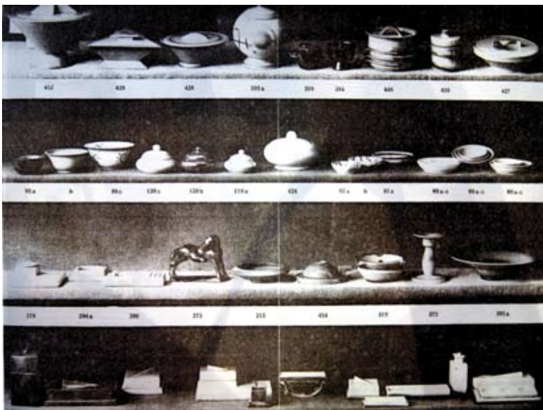
Diseños de Grete Marks. Catálogo de la empresa Häel-Werkstätten für künstlerische Keramik 1924. Conservado en Keramik-Museum Berlin, cortesía de su director Theiss Heinz-Joachim. Fotografía Marisa Vadillo

La metodología del taller textil no fue uniforme y evolucionó