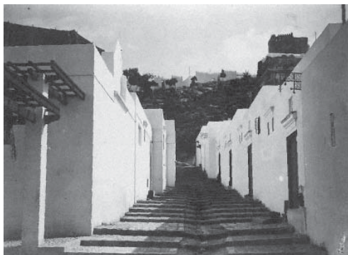
Fig. 1. Proyectos de viviendas de promoción oficial en Guinea Ecuatorial