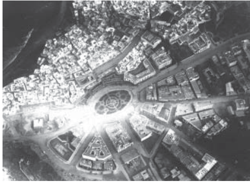
Fig.4: Plaza España, Larache, Marruecos, Años 30. Encuentro de la ciudad histórica y la ciudad colonial hispano-marroquí.

y hoy se defiende desde las instituciones públicas e internacionales –al menos teóricamente– la apropiación, participación y gobernanza local como herramientas de promoción de un desarrollo integral. Sin embargo, aún no se ha llevado a la práctica y se ha tomado conciencia lo que supone la crítica post-colonial, y el fomento de su reverso: la equidad entre diferentes, el diálogo, la nivelación de poderes.