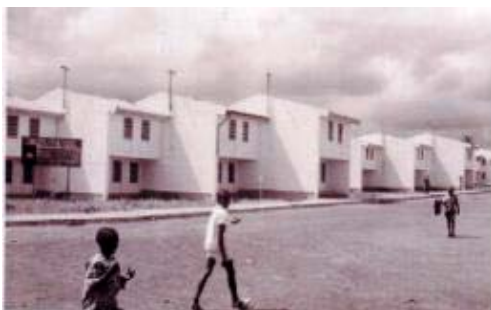
Fig. 3. Proyectos de viviendas de promoción oficial en el Norte de Marruecos