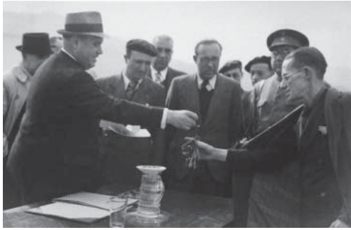
Fig.5. Entrega de llaves. Viviendas de promoción oficial para excombatientes españoles en la Guerra Civil. Tetuán, 1939.

No solo los criterios temporales, estilísticos y culturales de aplicación usual son puestos en entredicho, sino que la propia consideración de la arquitectura moderna como patrimonio cultural africano choca con la identificación con el poder de opresión que se fomentó en pleno proceso de independencia. Sin embargo, desde GAMUC consideramos que más allá del peso de esos discursos oficiales, su valor como testimonio de un proceso de modernización, con sus luces y sombras, es fundamental para entender la realidad africana contemporánea y, de manera especial, la singularidad de lo cotidiano que representa la vivienda.