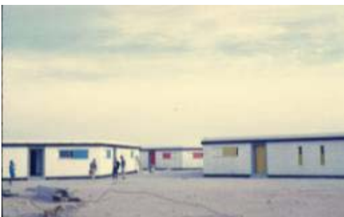
Fig. 2. Proyectos de viviendas de promoción oficial en Sahara