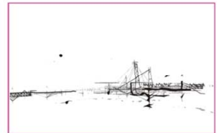
Dibujo de New Babylon (Constant, 1963). M.F. Carrascal, 2008.