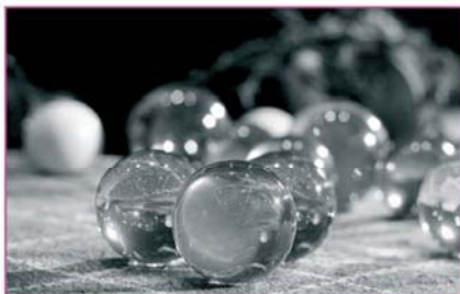
Rodando 2, 2009 Ana Blanco Campe.