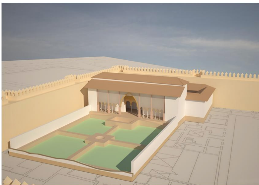
Figura 2- Infografía del primer palacio del Alcázar de Sevilla levantado durante los últimos años del s.XI y principios del s.XII