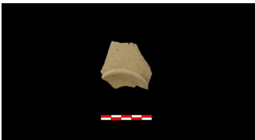
Figura 4- Muestra de fragmento cerámico tomada de uno de los lienzos del muro