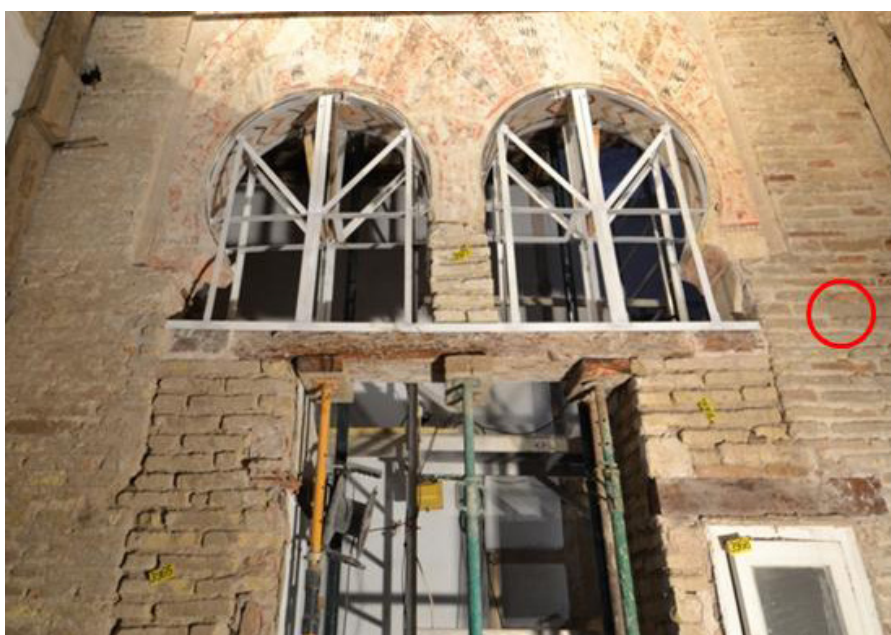
Figura 5- Zona de toma de muestras de fragmento de ladrillo de un muro interior de ladrillo y mortero de cal.