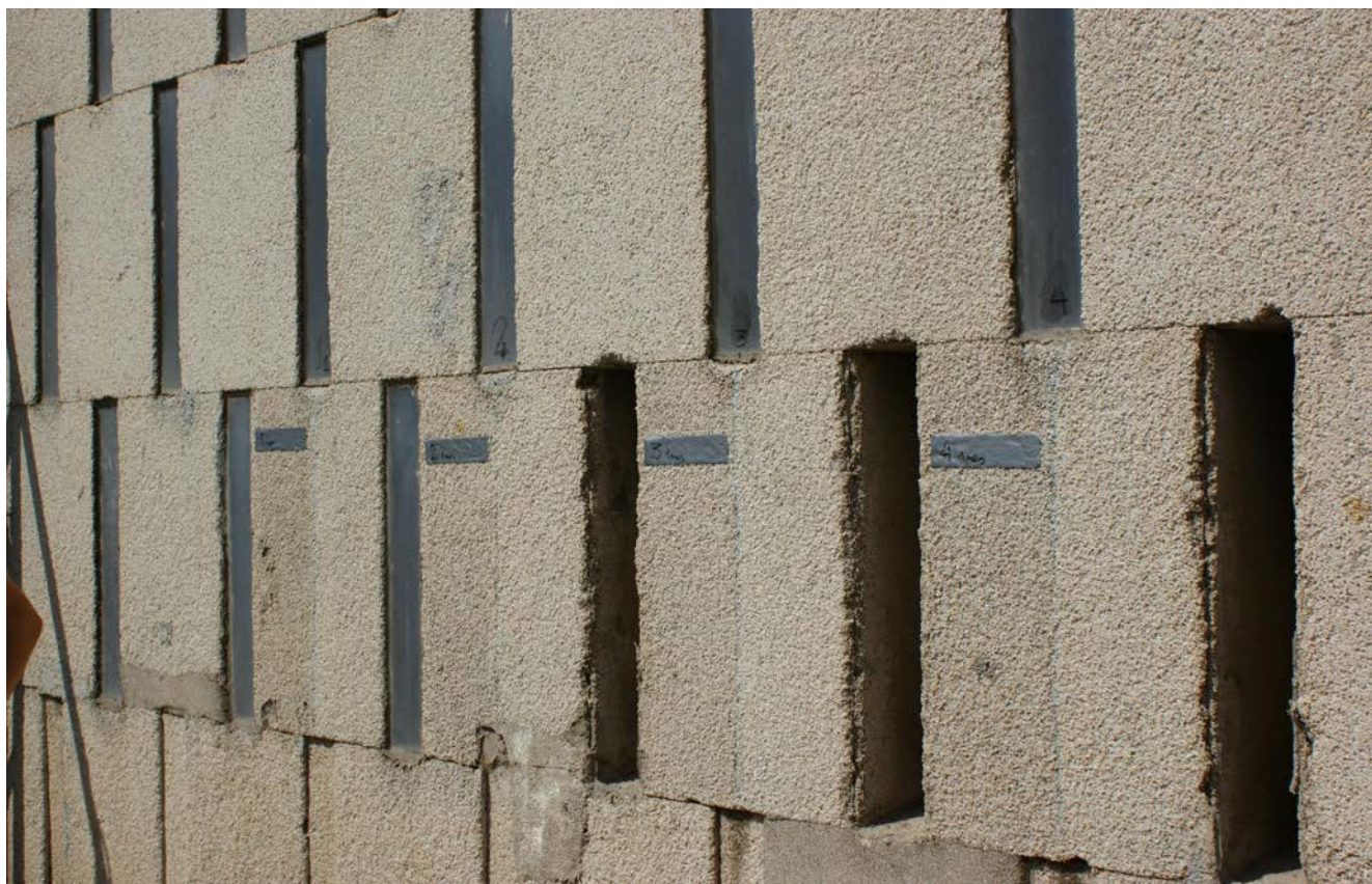
Figura 7. Ensayo de resistencia superficial al arrancamiento sobre placas de fachada.