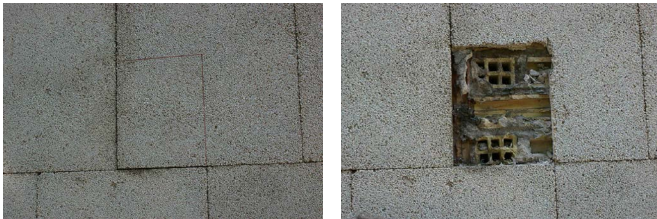
Figura 3. Toma de muestras del aplacado.

suficiente de agregado desprendido, sometiéndose éste a un proceso de limpieza mediante soplado, flotación y posterior desecación. El reconocimiento visual del árido, apoyado por instrumental de aumento, permite clasificarlo petrográficamente como un mármol machacado o marmolina, no presentando indicios de alteración química ni física, las imágenes tomadas con lupa de aumento permiten comprobar en la cara exterior de la placa las superficies inalteradas de los granos de marmolina, así como los restos de la resina que los mantienen unidos, por el contrario en la cara interior se observa cómo la resina recubre completamente los granos, compactándolos y aislándolos (Figura 4). Con este árido se realizó un ensayo de carácter organoléptico para ver el efecto que sobre el árido suelto producía la pulverización de los productos consolidantes.