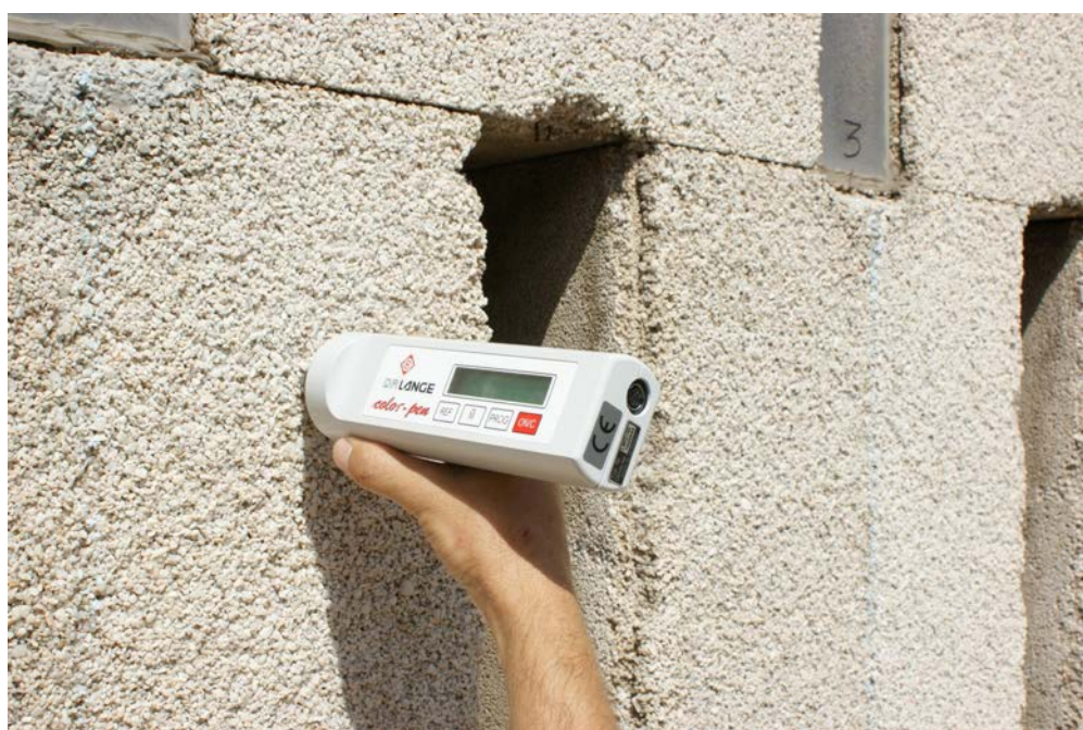
Figura 5. Determinación colorimétrica sobre placa de fachada.

Con los productos seleccionados a partir de la información suministrada por los análisis de los FTIR sobre la similitud de resinas actuales y la original se realizaron pruebas de capacidad consolidante. La elevada porosidad de las piezas y su sección (1,5 cm) permitía, a priori , presuponer una correcta penetración de los productos a través de la estructura de poros/huecos, en cualquier caso, como evaluación previa, se aplicaron las resinas sobre las probetas por pulverización hasta saturación superficial, pudiéndose comprobar la penetración alcanzada por el afloramiento de producto en la cara posterior de las probetas. Igualmente, con el fin de comprobar los tres productos se aplicaron en el laboratorio mediante pulverización en spray sobre marmolina limpia y suelta,