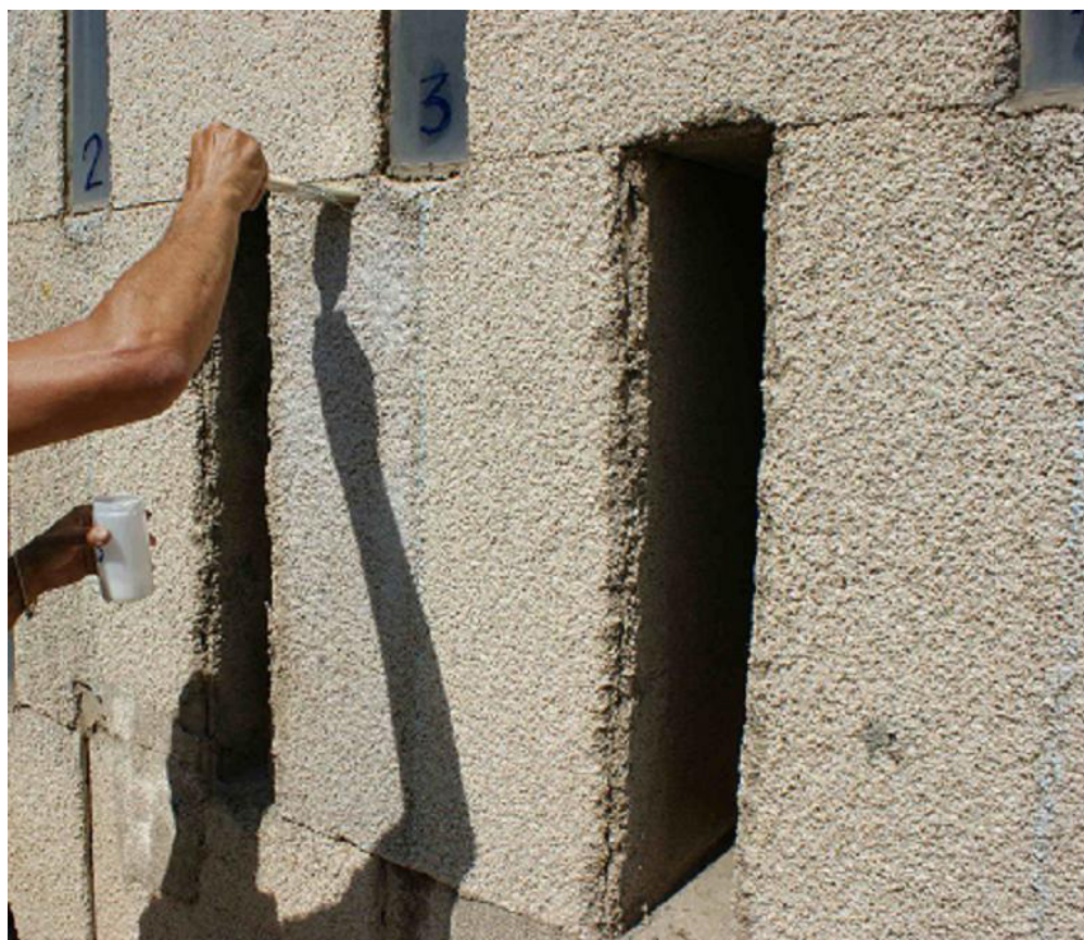
Figura 6. Aplicación de los tratamientos para los ensayos de evaluación de propiedades y comportamiento sobre el aplacado.

Los espectros de FTIR indicaron que las resinas Acrisil201, BA2028 y Epo150 tienen una naturaleza muy diferente a la resina utilizada en el revestimiento, mientras que las otras tres resinas (Acril33, Fluoline y ParaloidB72) muestran espectros más similares al producto original, ya que son resinas acrílicas en las que el grupo éster está presente en su estructura y por tanto presentan bandas intensas similares. Sin embargo, como se ha indicado anteriormente, parece que la resina aplicada no es acrílica sino una resina de poliéster. No obstante, dadas las propiedades que muestran estas resinas respecto a su resistencia a radiaciones UV y a la humedad y su similitud estructural