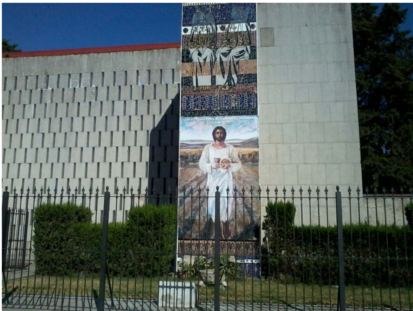
Figura 1. Imagen exterior del templo de San Pablo (Sevilla).

Debe reseñarse la importancia del buen criterio establecido por los técnicos responsables del proyecto de restauración de