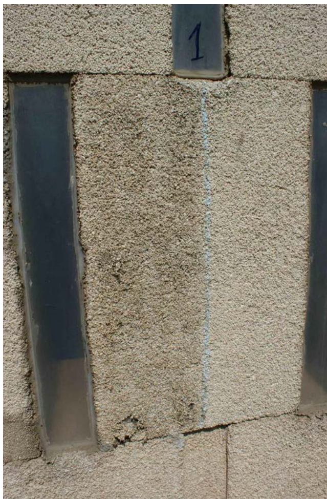
Figura 10. Se aprecia la ligera deformación debida al ataque del disolvente del tratamiento sobre la resina original, dando lugar en primera instancia a pequeños desprendimientos.