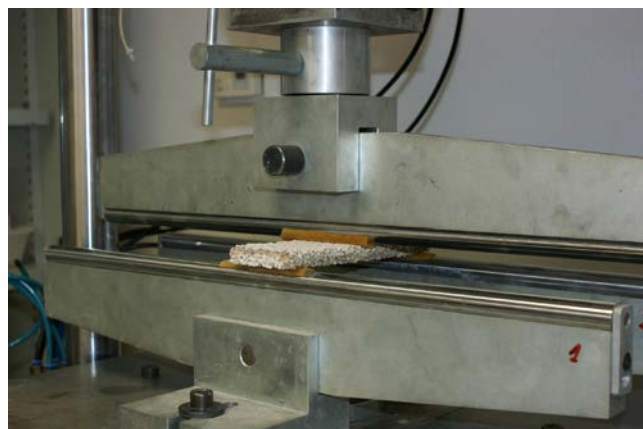
Figura 9. Imagen de las muestras de las placas de revestimiento y de una de las placas durante la rotura.