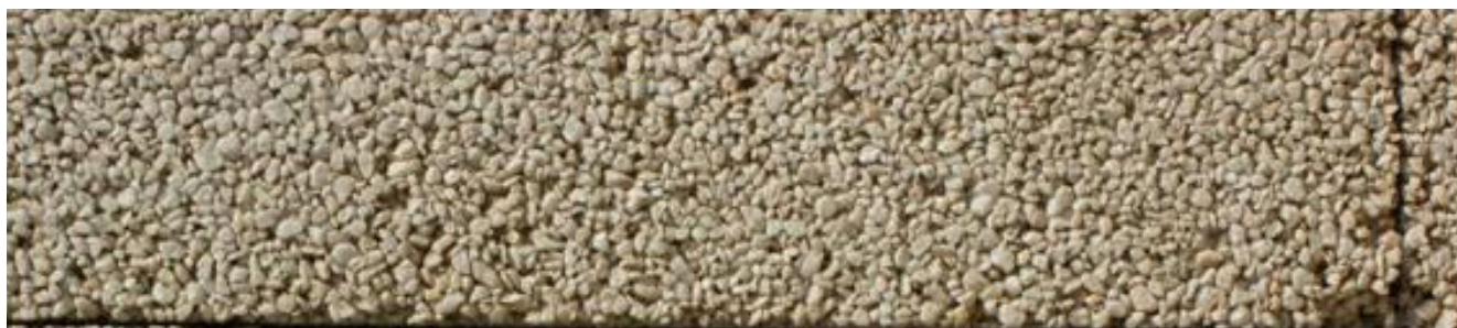
Figura 8. Imagen en la que se puede apreciar el aspecto de árido unimodular del agregado utilizado en la fabricación de las placas.