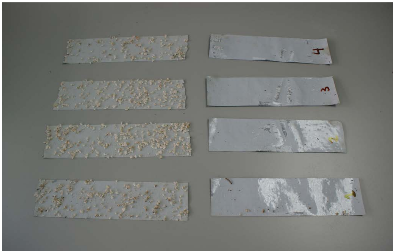
Figura 11. Imagen de las muestras de las placas de revestimiento y de una de las placas durante la rotura.

Las alteraciones cromáticas resultado de la aplicación de productos son consustanciales a una actuación de este tipo, ahora bien, se ha garantizado a través del control colorimétrico, atendiendo a las particularidades de la superficie analizada, que las modificaciones sufridas se han desarrollado siempre en un espectro visual aceptable.