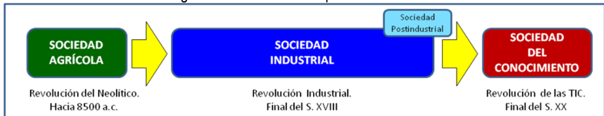
Figura 1: Cambios en las prácticas sociales

Y, tras un periodo de transición al que no se sabe cómo llamar (sociedad postindustrial, de la información...), la revolución de las tecnologías de la información y la comunicación dan lugar a la sociedad del Conocimiento. Donde los sistemas informáticos, internet, la inteligencia artificial, el big data... son elementos revolucionarios para el cambio de era. Y donde la energía y el conocimiento, en estos momentos, están fuera de la persona (Gago, 1995).