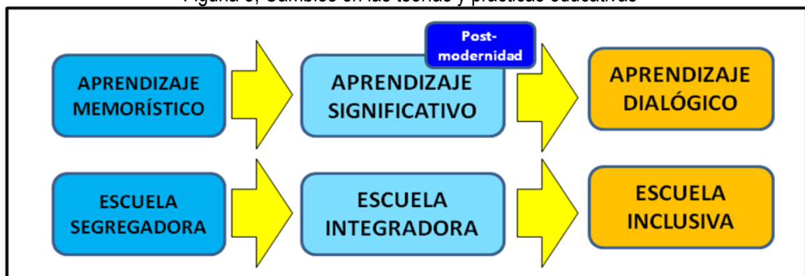
Figura 3, Cambios en las teorías y prácticas educativas