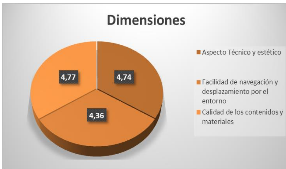
Gráfico 1. Valoración media alcanzada por los expertos en cada una de las dimensiones del entorno.

A continuación, para efectuar un análisis con mayor exhaustividad, iremos comentando en las sucesivas líneas cada una de las dimensiones y las medias y desviaciones típicas alcanzadas en cada uno de los ítems que la forman.