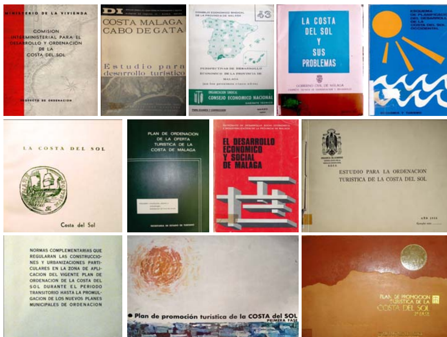
Fig1. Secuencia de los estudios, informes y planes de ordenación de la Costa del Sol seleccionados para nuestro estudio.

No es casual por tanto que los órganos de ordenación y control se solaparan o se volvieron rápidamente ineficaces. Del estudio pormenorizado de los mismos obtenemos conclusiones tan dispares como la rápida caducidad de aquellos instrumentos, la inoperancia de las herramientas y la desorganización de los propios órganos de gobierno y administraciones para la puesta en práctica. Junto a ello, la mano privada tuvo mucho que decir en la Costa del Sol, y no sólo los créditos hoteleros y ayudas al sector turístico-inmobiliario promocionaron que esta situación se reforzara con el paso de los años, sino que por circunstancias de la vida, el poder que alcanzó en el panorama turístico fue ganando terreno a cualquier otra inversión.