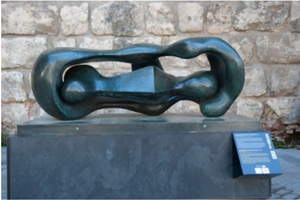
Figura 2. Henry Moore, Grande formas conectadas reclinadas , 1969-1974. Arte en la calle. Henry Moore. Sevilla 2014.