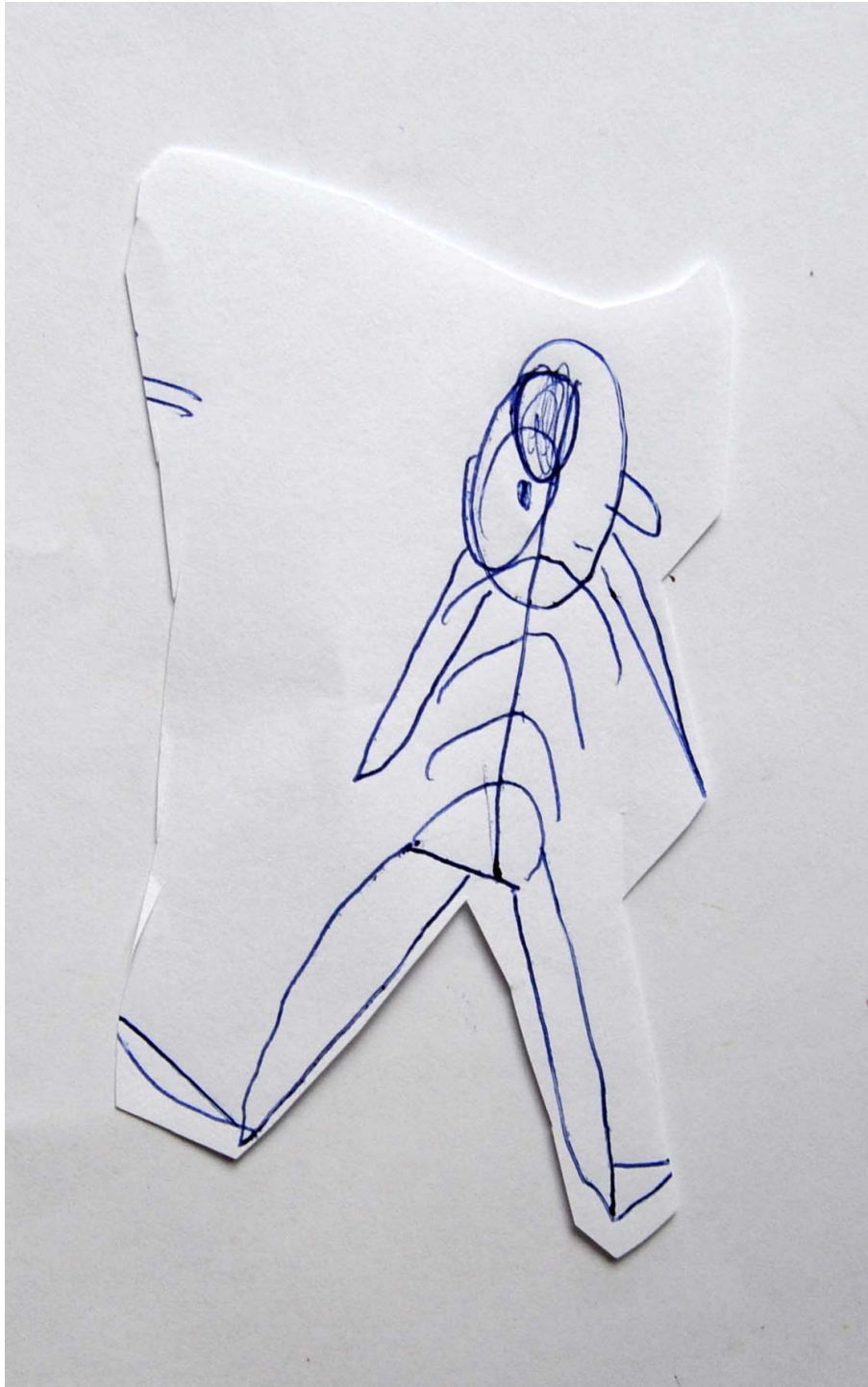
Fig. 1. Dibujo niño de 4 años.

Este tipo de abstracción sería frecuente en el arte infantil, siendo especialmente significativo en las representaciones del ser humano, donde dibujan con gran fuerza y plasticidad, la figura de un individuo con los elementos constitutivos universales de nuestra especie (Fig. 1).