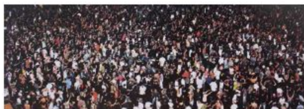
Fig. 2. Andreas Gursky. May Day IV, 2000. Fotografía cromogénica.

con la imagen May Day IV , de Andreas Gursky.