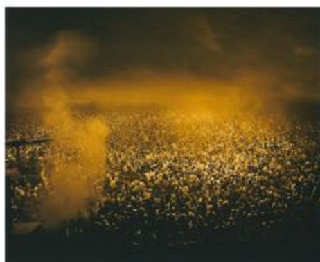
Fig. 1. Andreas Gursky. May Day III, 1998. Fotografía cromogénica.

vienen a ser el símbolo de esta soledad individual, pero colectivamente compartida. Desde principios de la década de 1960, se ha duplicado el porcentaje de personas solas, que ya en 2004 se situó cerca del 14% (Lipovetsky, 2010, pp. 61-62). El sentimiento de soledad, lo refleja de manera suprema el escritor colombiano Gabriel García Márquez. En los personajes de su novela Cien años de soledad , publicada en 1967, se describe este carácter solitario, actitud también expresada en el contexto espacial donde transcurre la historia. Aunque ésta sea una historia ficticia, resulta significativo cómo a través de la literatura, García Márquez nos introduce en un tema crucial para comprender un designio de la humanidad.