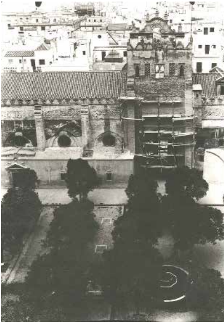
FIG. 4. Hacia 1948 aun se conservaba, a la derecha, la escalera del XIX.