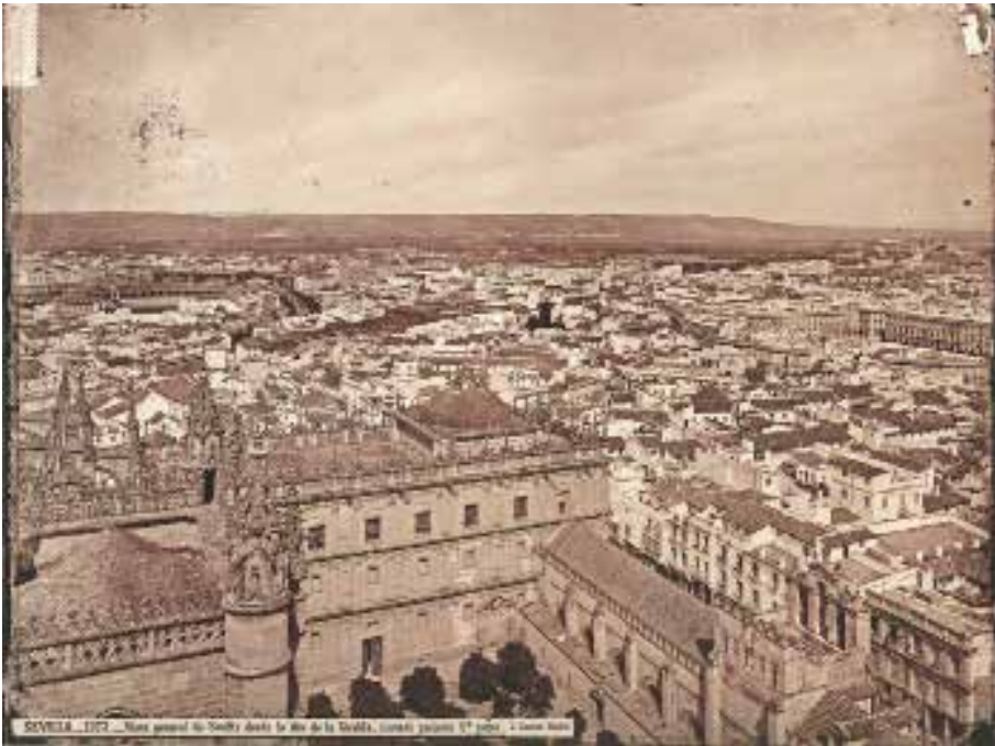
FIG. 3. El patio de los Naranjos hacia 1872, en una foto de J. Laurent.

cientado y complejo, como resultado de tres o más etapas constituyentes. Las obras de don Félix para la restauración del patio empezaron en 1941, pero hasta 1945 no llegaron sus trabajos a la puerta del Perdón, empezando con el derribo de las obras modernas y los enlucidos que estimó recientes, 7 aunque, como era tradicional en él, y en la administración de la época, la solución tuvo que esperar durante décadas.