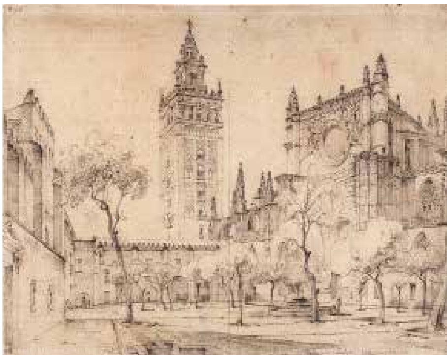
FIG. 2. El patio de los Naranjos en 1833 según Richard Ford.

patio de los Naranjos hasta llegar a dos dibujos fechados en 1833 5 (FIG. 2); al menos las fotografías, empezando por una de Laurent de hacia 1872 6 (FIG. 3), acreditan que el paramento, que actualmente queda oculto por la obra de madera, era bastante ac-