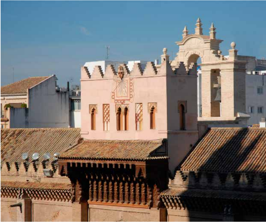
FIG. 1. La parte alta de la puerta del Perdón en 2016, desde el SE.

en la aljama, el único con decoración latericia y el que muestra la decoración más exuberante, como corresponde a su privilegiada ubicación. Su cara meridional está enmarcada por medio de un alfiz liso y finaliza con una cornisilla ubicada a la misma altura y con un perfil similar a la que vemos sobre los arcos de las galerías inmediatas; sobre ella aparece el tejaro­z que nos interesa, cuya descripción confiamos a las fotos adjuntas y a la planimetría publicada, 4 en la que podemos comprobar su exuberancia decorativa e importantes dimensiones, pues tiene 3,30 m de desarrollo vertical, 8,78 m en horizontal y sobresale 2,12 m del paramento del arco (FIG. 1).