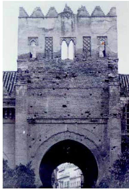
FIG. 5. Aspecto que presentaron las huellas del tejeroz entre 1954 y 1968, cuando la escalera ya ha desaparecido.

Las medidas generales del tejeroz están claras en la memoria del proyecto «Tuvo pues que medir, este alero, 8'80 de ancho, por 2'60 de alto pues [...] De las referidas dimensiones, la primera hubo de coincidir con la distancia entre los laterales externos de uno y otro contrafuerte del hastial de la citada puerta [...] que] actuaron de zancos de los mensulones de flanqueo [...] En cuanto a la altura de ese cuerpo sustentante, es decir, del bastidor de fondo del mencionado cuerpo, a la vez que soporte vertical del que fuera sofito del alero, la definen, dos relexes delimitativos uno, en lo bajo y, otro en lo alto, del lienzo mural en que el citado bastidor se respaldaba. De esos relexes el inferior, de 48 cm de retranqueo, corrido como 60 cm por encima del intrados de clave del arco de la puerta, y coincidente, en nivel, con el pié de alero de las inmediatas galerías, constituyó peana del mencionado bastidor, mientras el otro, mucho menos retranqueado que su congenere y habilitado como 2'60 m por en cima de esta, constituyó ristrel de apeo de las vigas de remate de los canes [...]». Conviene insistir en que la altura de 2,60 m, que escribió don Félix, no es la del tejeroz, sino la distancia vertical