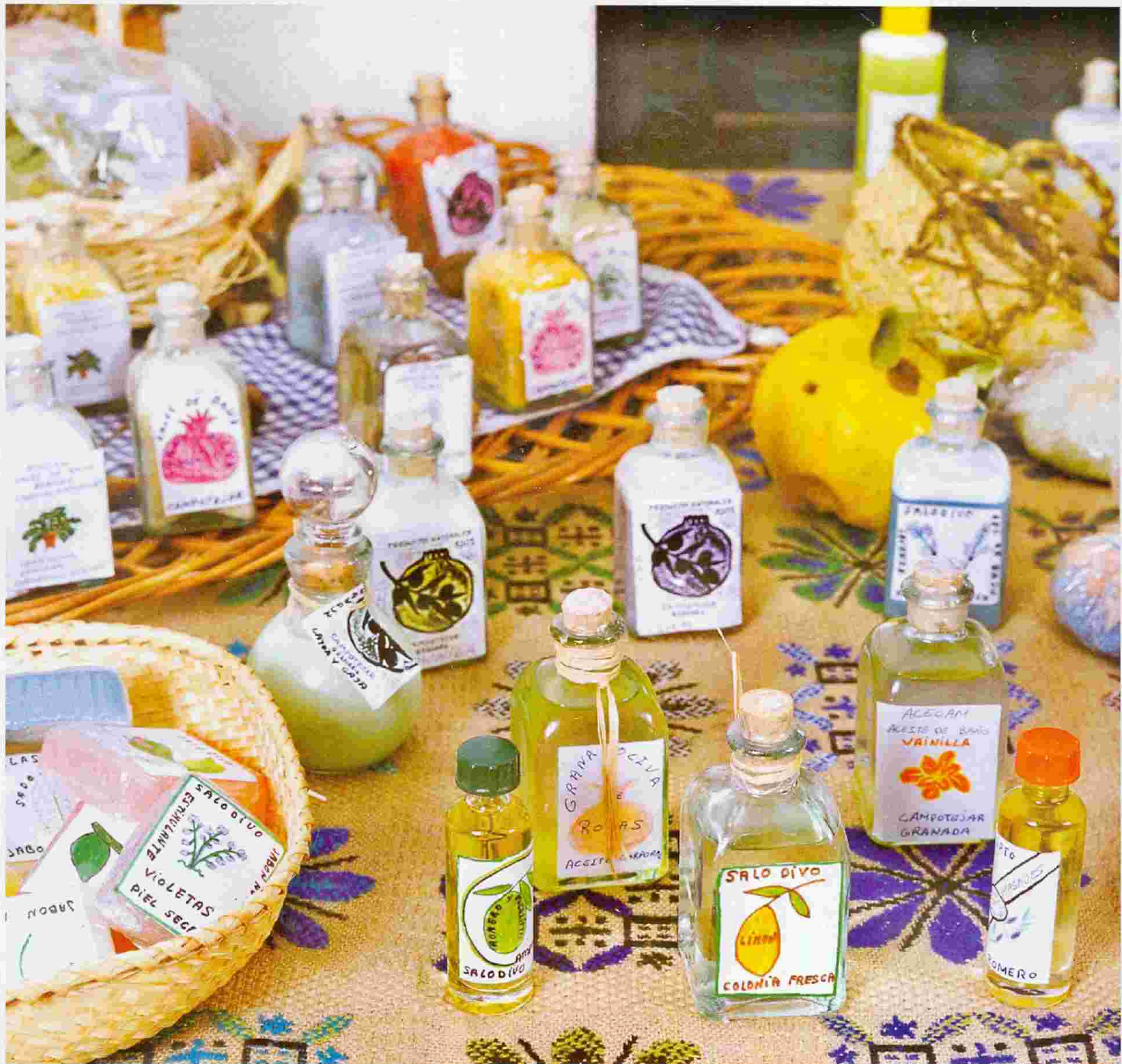
Productos pertenecientes al proyecto de Campotéjar (Granada)