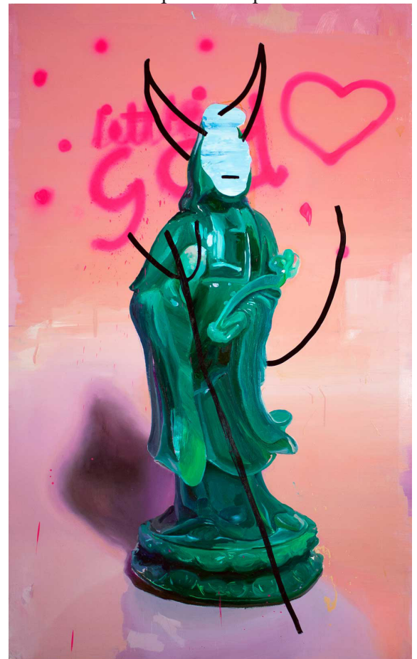
En algo hay que creer.

La agrupación de objetos eliminando los espacios es mucho más personal en Viva el vino , la pintura distinguida con el Premio Internacional de Pintura Focus 2016. Lo es por muchos motivos, el principal la aceptación de la volumetría y la configuración con recursos plásticos que remontan sobre el imaginario pop dejándolo muy atrás con criterios propios. Los objetos adquieren así un nuevo sentido plástico reagrupados y ofrecidos en función de las relaciones internas que rigen en todo momento. En éstas se detectan una enorme lucidez y un gran talento. Las flores de plástico y los animales se entremezclan siguiendo un patrón fundamental, las posiciones en diagonal y sin atención a la línea de tierra, generando desplazamientos centrípetos que sólo frena el caballo blanco que recoge los empujes en la parte trasera. Dos trazos amarillos con rotulador superpuestos matizan los significados, uno en forma de corazón trilobulado sobre los objetos indican el motivo de