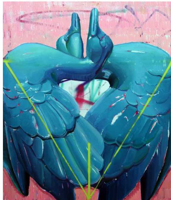
Una vez en la vida.