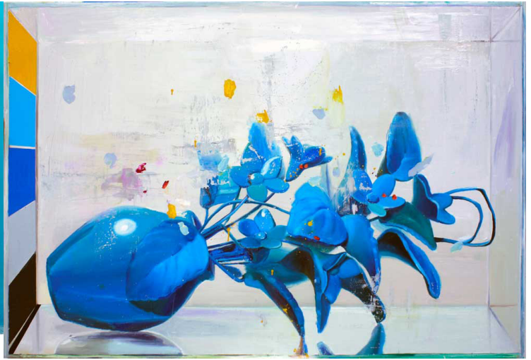
Hablemos de mañana, 2015.

mismísimo diablo, con la sola intervención de unos trazos de rotulador negro que representan los cuernos, el rabo y el tridente que lo identifican. En ésta, la perspectiva aérea del soporte rosa cambia de sentido en el fondo plano con el mismo color y distinto tono, en el que aparecen grafitis con el término Little God y un corazón 21 .