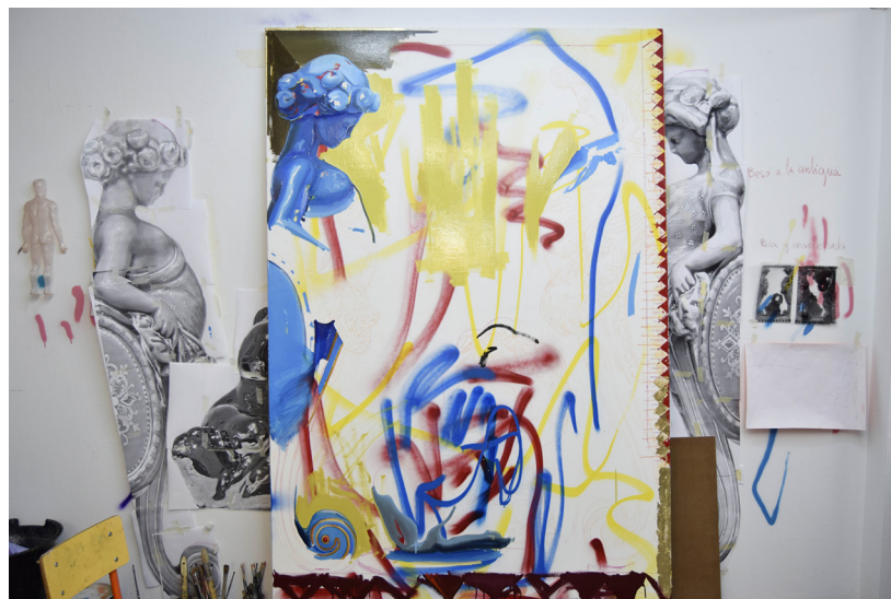
Beso a la antigua.

y muy potentes visualmente. La dinámica de las superposiciones mantiene un lejano recuerdo de las soluciones alternativas características de Luis Gordillo; sin embargo, la naturaleza de la configuración y el alcance estético son muy distintos.