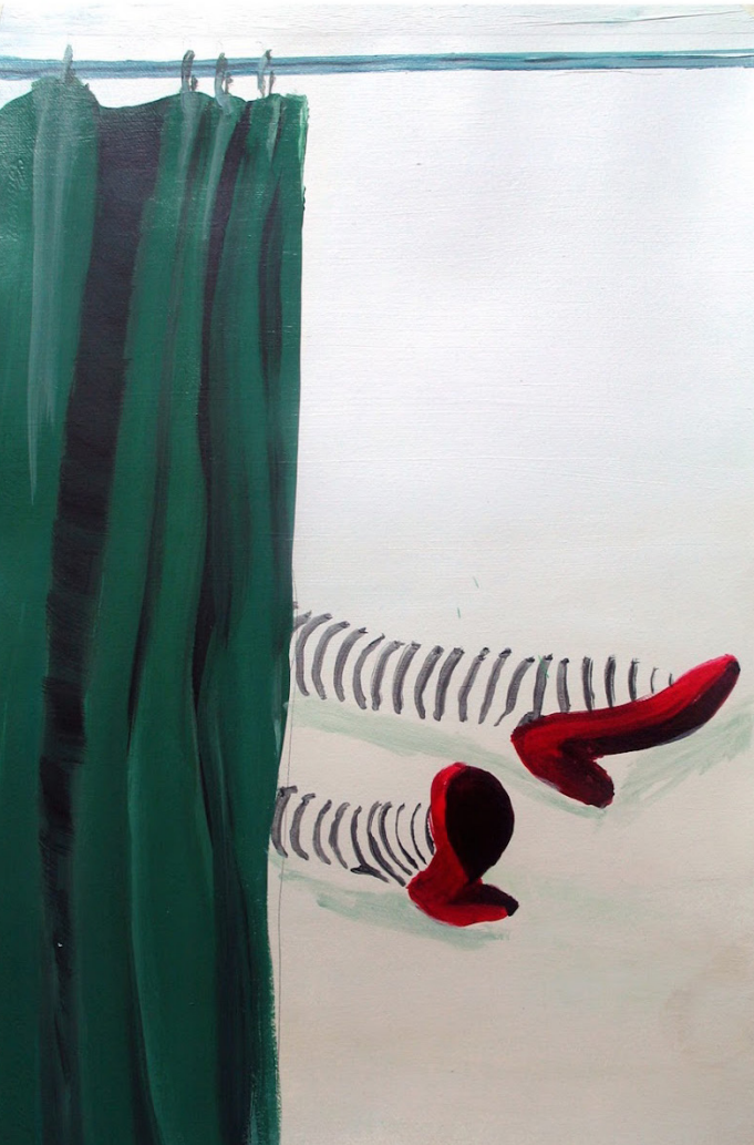
Un, dos, tres, cuatro, 2010.