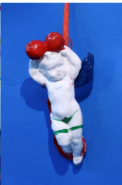
Que el niño venga sexy.