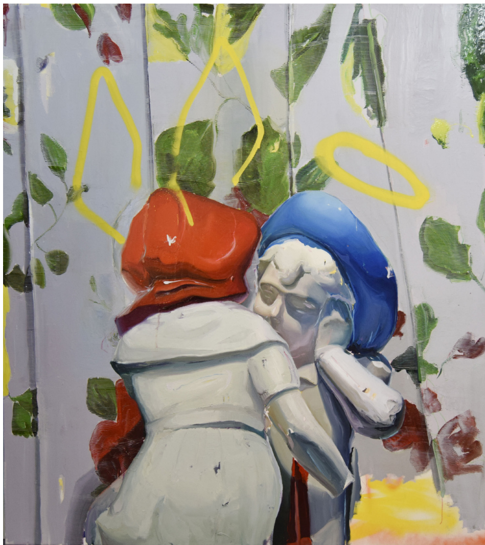
Polvo y oro.