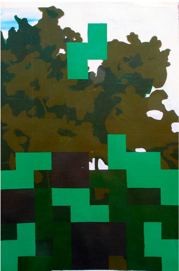
El juego I, 2011.

relacionar las claves visuales que la pintora introduce en relación con el objeto principal de la composición, tomado de la realidad más cotidiana. La re dimensión plástica de unos y otros es fundamental. Unas veces establece con ello un mensaje más o menos claro; otras, uno con tantas posibilidades de interpretación como capacidades receptoras tengan los espectadores. Eso la lleva a la ironía, a la crítica suave y amable en sus formas y profunda y aguda a la vez en las relaciones intelectivas que podemos establecer.