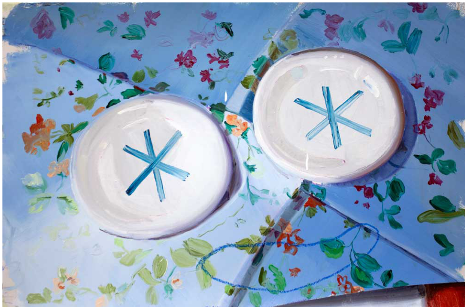
Se te nota en la mirada.