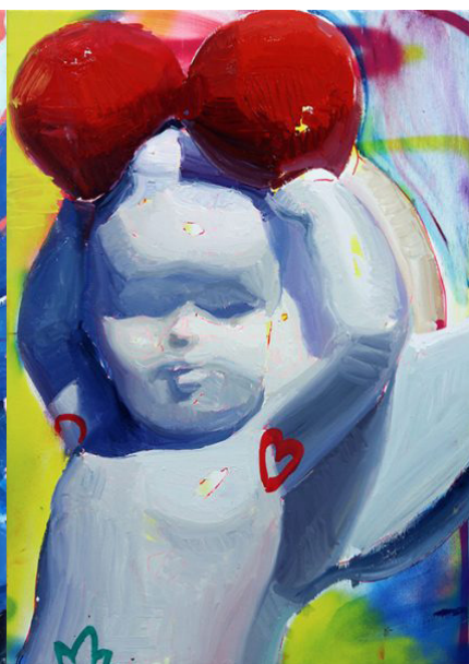
Por ti seré.