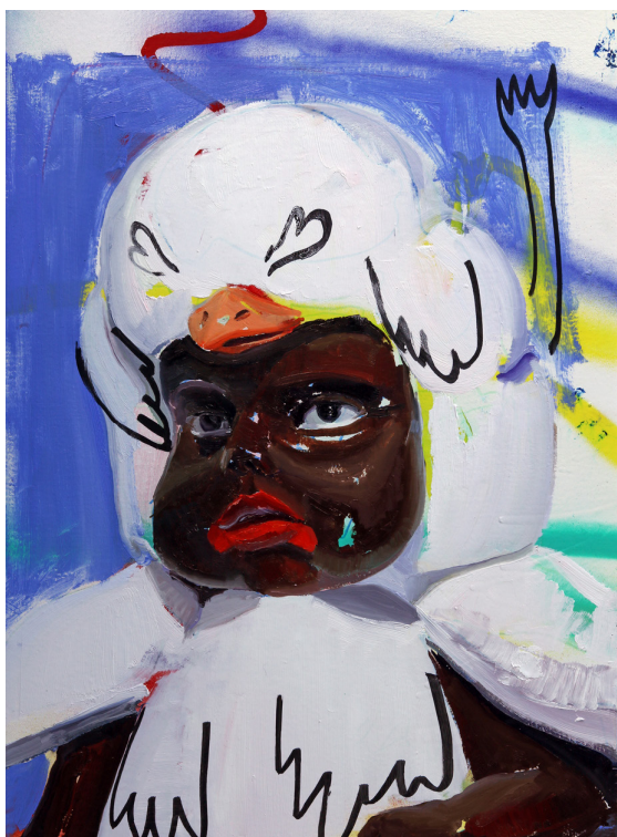
Soy tu pollo, 2017.

El objeto re dimensionado es protagonista absoluto en pinturas como Boca cerrada , Por ti seré y Que el niño venga sexy , las tres con niños de serie reconvertidos en su significados con leves modificaciones sobre su condición primigenia como objeto. El primero de ellos alterado por las adiciones de color rojo que tapan la boca; las otras dos con los puños cerrados pintados de rojo, en el tercer caso además con éstos y las manos atadas colgados de una línea roja sobre el fondo azul. También en Soy tu pollo , en la que un muñeco infantil negro queda redefinido con la superposición de un pollo como si fuese la piel del león de Hércules, éste con trazos lineales complementarios que le cambian el sentido oprimiéndolo.