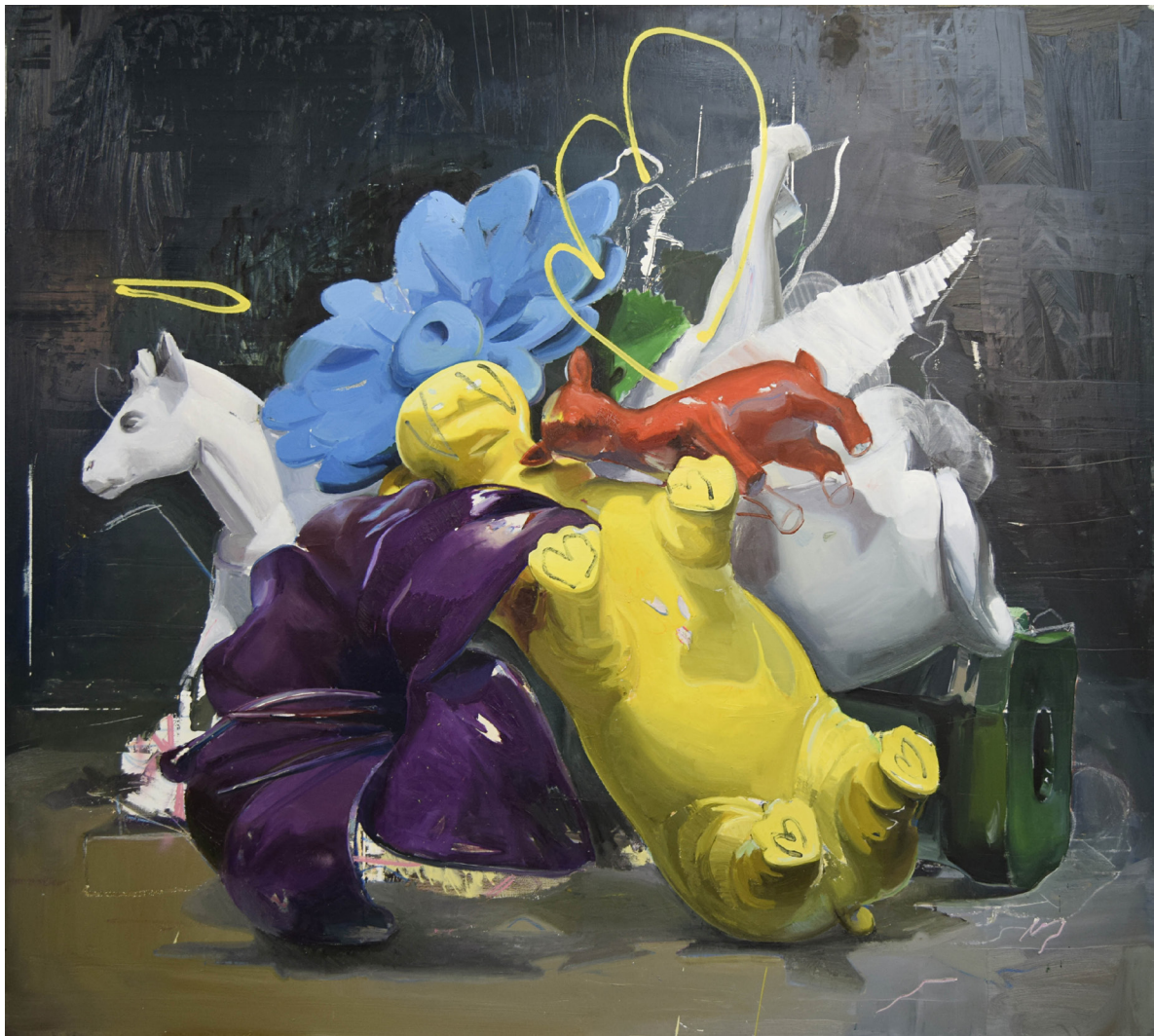
Viva el vino.

tal pérdida de equilibrio y el por qué de su ilógica reorientación; el otro en forma circular, señala el protagonismo del caballo como receptor de todo.