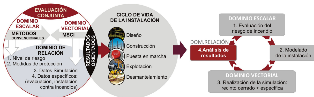
Figura 2. Modelo de integración y fases de aplicación.