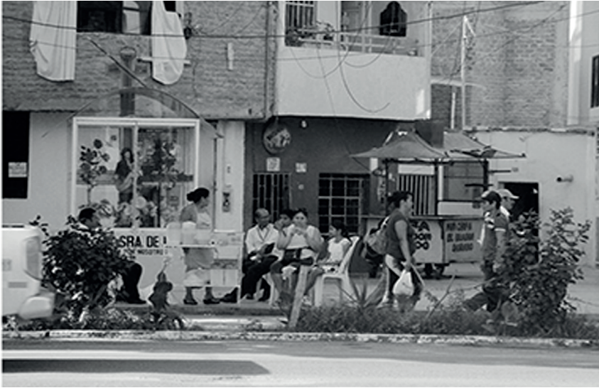
Figura 4. Casas productivas. Chiclayo. Perú. (Ftgs. Balcazar y Guado).