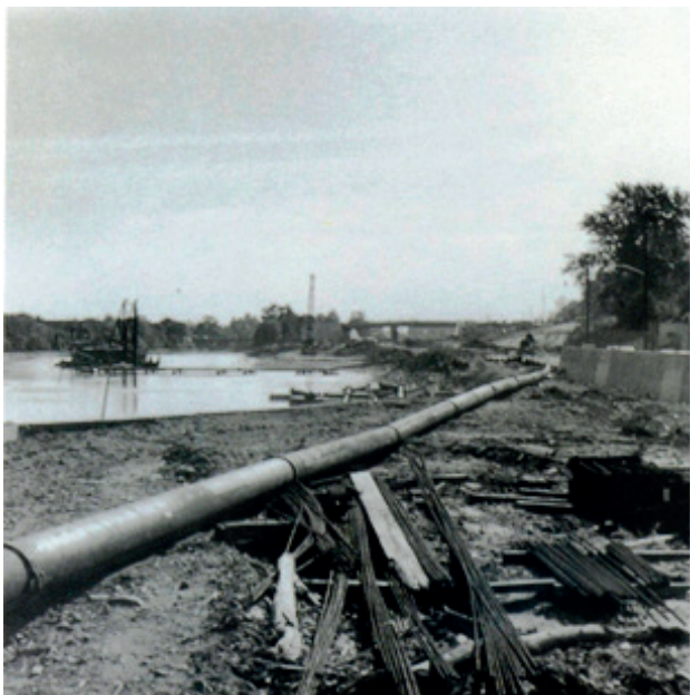
Figura 2. Robert Smithson, Monuments of Passaic (New Jersey), 1967.