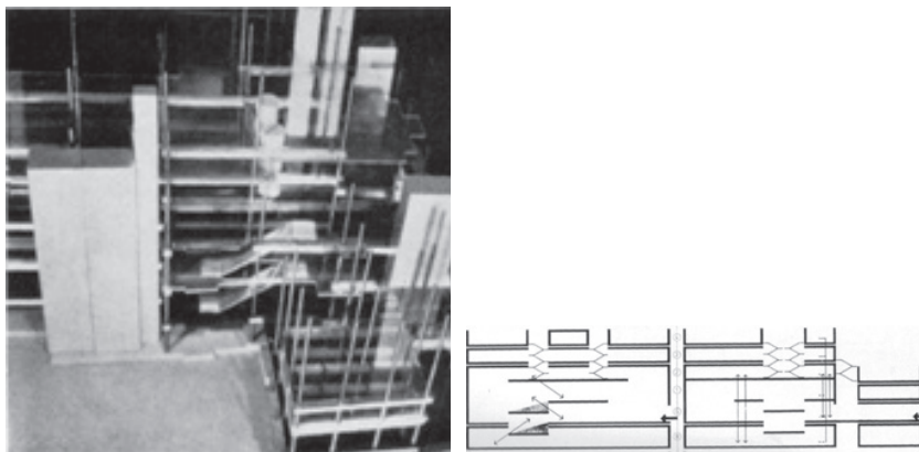
Figura 6. Cedric Price, Oxford Circus Corner House London, 1966. Self-Pace Public Skill and Information Hive.

la multiplicación de los sueños. El espacio surge como una rotura y apertura del mismo que solo el tiempo de habitar como alteración podrá ir conformando.