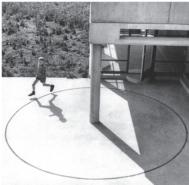
Figura 3. Aldo Van Eyck, Orphanage, Amstelveenseweg, Amsterdam (Países Bajos), 1955-60).

Robert Smithson a través de su épico recorrido por los “monumentos de Passaic”, llevó a cabo un ensamblaje a través del desecho y el deterioro. Pero no lo hace mirando al paisaje, no hay horizontes; su mirada se resuelve a través del suelo como espacio de relaciones y de concertación. El suelo hace de unión entre lo dispar y lo heterogéneo, reunión de tiempos y de desechos. El suelo puede juntarlo todo gracias a la acción de recorrerlo o practicarlo. (Fig. 2 )