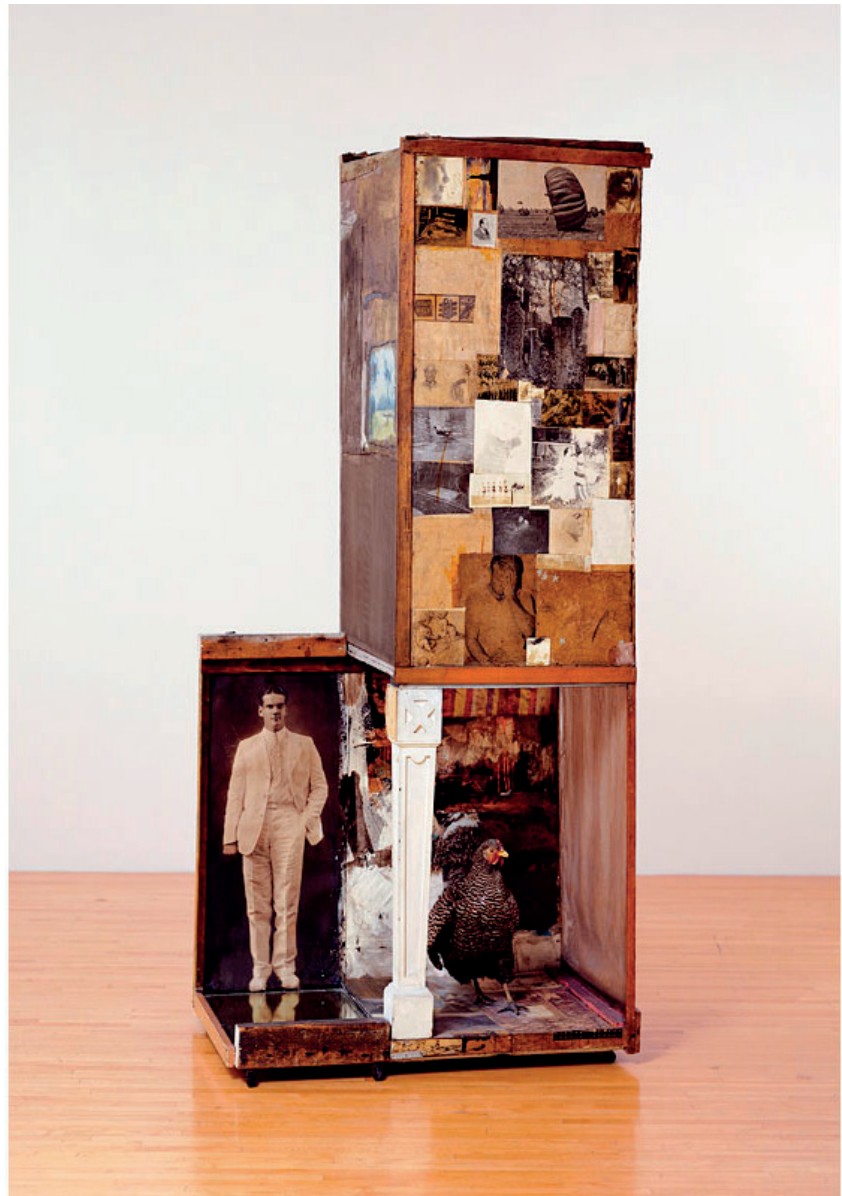
Figura 1. Rauschenberg, Untitled , 1954).

En correspondencia con esta intención, la acción proyectual debería centrarse en provocar e inventar modos de estar juntos 3 .