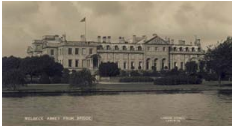
Fig. 02 Welbeck Abbey, 1860.