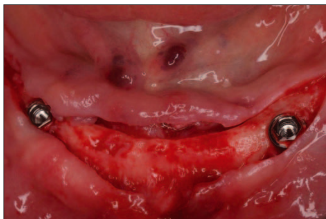
Fig. 3: Aspecto clínico de los implantes insertados en la mandíbula.