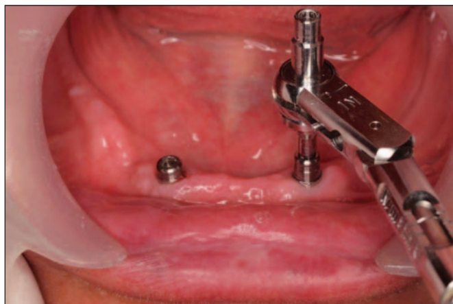
Fig. 5: Carga funcional precoz. Colocación de los ataches sobre los implantes a las 6 semanas.

El tiempo transcurrido de seguimiento clínico desde la carga funcional de todos los implantes fue al menos de 24 meses. Se realizaron revisiones clínicas de los pacientes, valorando el estado de los implantes y de