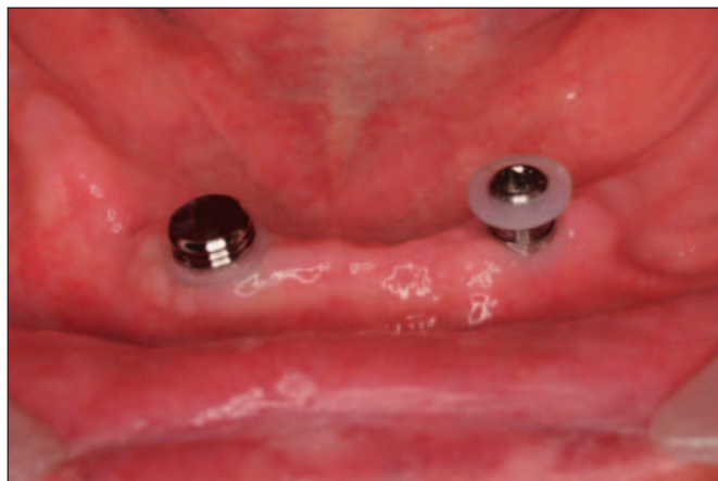
Fig. 6: Aspecto clínico de la sobredentadura retenida por los 2 implantes mandibulares.