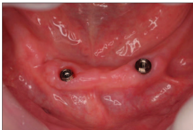
Fig. 4: Aspecto clínico de los 2 implantes a las 6 semanas.