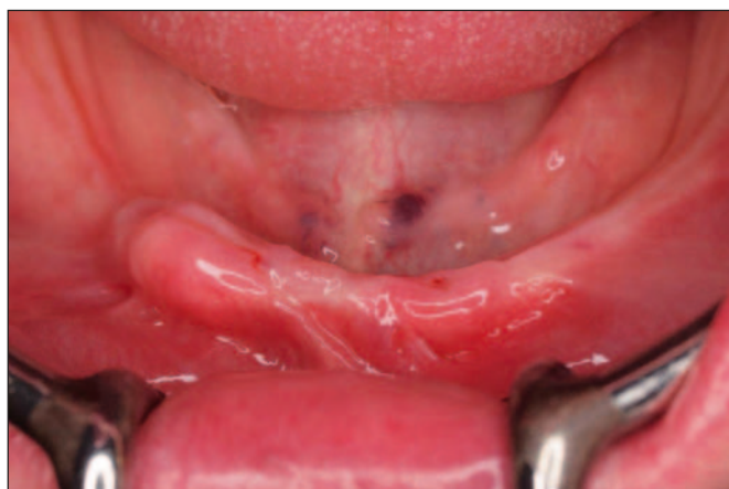
Fig. 1: Aspecto oral del paciente edéntulo.