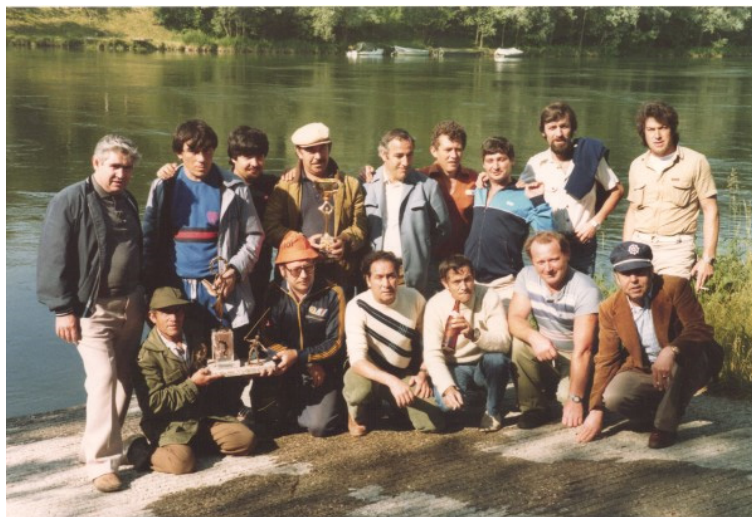
Imagen 8. Grupo de amigos en campeonato de pesca (Suiza), años 1970. Ejemplar escaneado.

Para reforzar el éxito de la emigración es recurrente la fotografía de momentos de ocio en lugares lejanos. Allí se muestran nuevas modalidades de ocio no conocidas en los lugares de origen. Así, una estación de esquí en Suiza es un lugar exótico de representatividades del éxito migratorio o la participación en un campeonato de pesca en los lagos suizos.