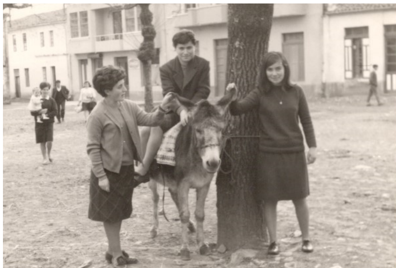
Imagen 18. Grupo de amigas en Melide, años 1960. Ejemplar escaneado.