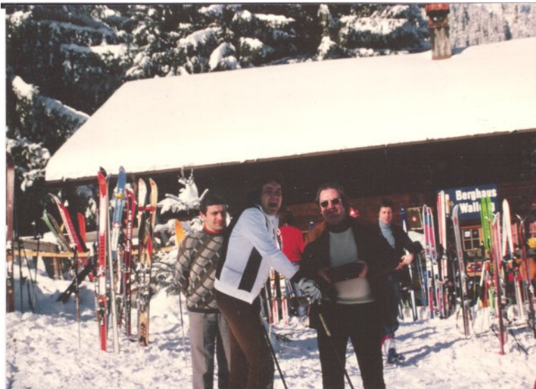
Imagen 7. Grupo de amigos en estación de esquí (Suiza), años 1960. Ejemplar escaneado. Donado por Manuel Prado Pintor

Además, el acceso a la cámara fotográfica comenzó a popularizarse, a democratizarse y se tenía acceso a un amplio elenco de fotografías. Las fotografías de las migraciones de estos años nos dan cuenta del acceso a una forma de vida muy diferente a la que se dejaba en el lugar de origen. En los años setenta la modernización es un claro signo de desarrollo y de ascenso social. De ahí que la fotografía cambie, se vuelva más espontánea. Ya no encontramos imágenes familiares de grandes posados cenitales sino que el lenguaje vulgar y común de la fotografía se ampara en la proximidad y en la figuración cercana. En las imágenes 5 y 6 vemos como la tecnificación en el entorno cercano hace que se denote la importancia y la estratificación laboral del trabajador. Se muestra, por un lado, la realización de tareas de importancia sin mirar a la cámara porque es más importante la tarea que el retrato. Signos de profesionalidad con las que se ha alcanzado posiciones laborales de importancia. La vestimenta es también el signo de mejor, ya no están con monos de trabajo sino con corbata. En la imagen 6, si bien las vestimentas son de trabajos más manuales, la significación de la modernidad la denota una complicada maquinaria de gran tamaño y ostentosa.