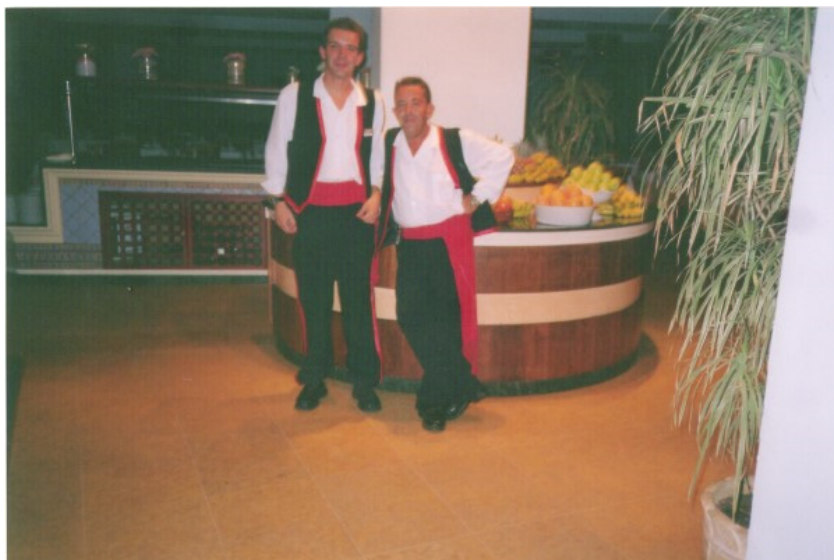
Imagen 23. Trabajadores gallegos en un hotel en Fuerteventura vestidos con el traje típico Canario. Ejemplar escaneado.