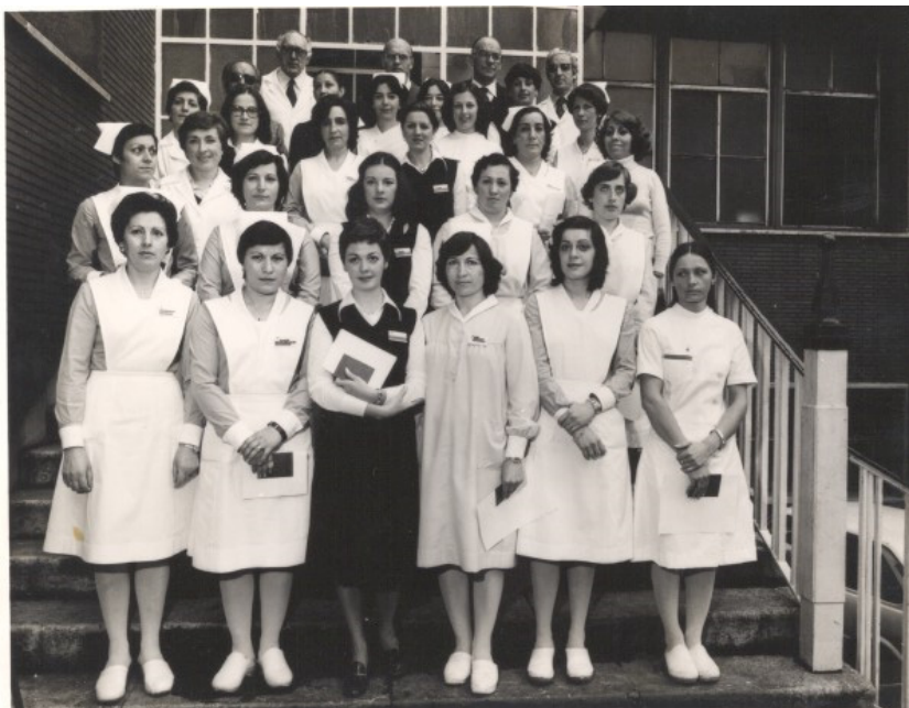
Imagen 9. Trabajadoras en el Instituto de Maternología y Puericultura de la Diputación Foral de Vizcaya, Bilbao, años 1970. Ejemplar escaneado.