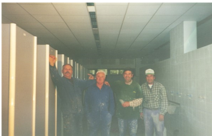
Imagen 24. Trabajadores gallegos en el País Vasco, años 2000. Ejemplar escaneado.

La emigración gallega, principalmente del interior rural sigue siendo una constante en la actualidad, bien porque no se proyectan posibilidades en el propio medio o bien porque en el imaginario colectivo se sigue preparando a los más jóvenes para dicho proyecto.