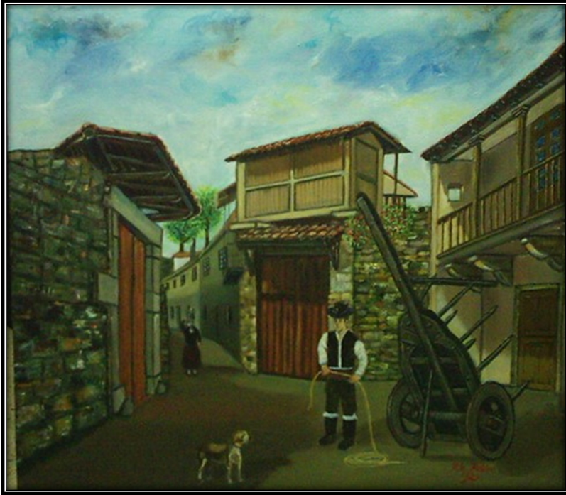
Imagen 22. Cuadro al óleo realizado por Milo Mosterio de la Plaza de las Ichoas de Melide. Ejemplar escaneado. Donado por Milo Mosteiro Mato

Es así como se entiende, y se ha expuesto en otro lugar (Prado, 2007), que la migración de jóvenes gallegos a principios del siglo XXI se dirija a los destinos de migración clásicos dentro del estado español, principalmente debido al auge de la construcción, pero también a nuevos destinos, como las Islas Canarias.