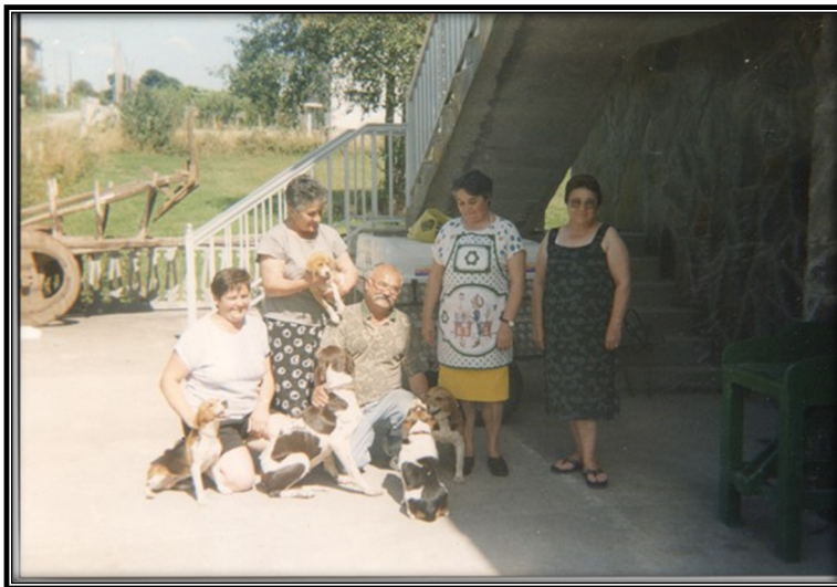
Imagen 19. Familia emigrada en vacaciones estivales, años 1990. Ejemplar escaneado. Donado por Gerardo Otero Montero y Maricarmen Vázquez Sánchez.

El recuerdo del origen común está siempre presente en los que se han ido. En las imágenes 17 y 18 observamos como el recuerdo del origen se guarda con recelo, y las familias emigradas conservan con orgullo las imágenes de su niñez o juventud en el lugar de origen. Pero también en elementos significativos, como se muestra en las fotos 19 y 20, de aquellos que vuelven en las épocas estivales.