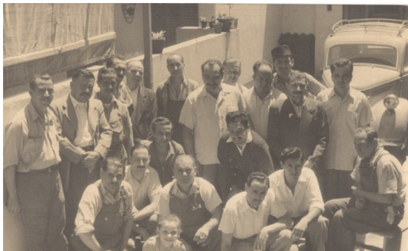
Imagen 4. Grupo de obreros en Argentina, años 1950. Ejemplar escaneado.

En las imágenes 3 y 4 vemos la singularidad de un día festivo y un día laboral en un entorno saludable. La imagen 3 muestra la misma predisposición familiar que observábamos en las imágenes de familia extensa con dos filas de individuos, mujeres delante y hombres detrás. Se ha incorporado descendencia que está al cuidado de las madres. Se muestran todos en un entorno natural con vestidos claros propios de situaciones de buena salud. En la imagen 4 observamos un entorno laboral. La imagen denota la buena situación laboral con un gran número de obreros en medio de tecnología destacada como eran los automóviles. Empezamos a ver algo que veinte años después será un claro signo de modernización industrial. Y con vestimentas de trabajo, bien arreglados y correctamente peinados. La situación denota por ambos lados el bienestar y la riqueza que se presumía de la emigración en tierras lejanas. La representatividad, real o ficticia, ampara un estado de bienestar y abundancia de esos años.