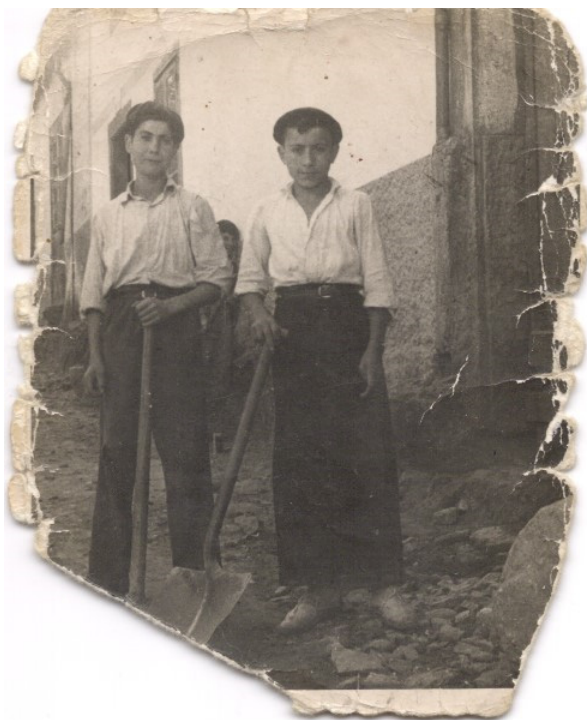
Imagen 17. Adolescentes en Melide, años 40. Ejemplar escaneado.