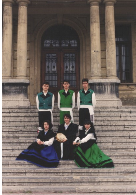
Imagen 16. Grupo Devalo da Lúa, salido del centro Gallego de Barakaldo, años 1990. Ejemplar escaneado.

Este proyecto migratorio fue altamente beneficioso también para el desarrollo comarcal. Es decir, el crecimiento del interior gallego se debe también a la inversión de estos migrantes en el lugar de origen. Volver en la época estival y potenciar el consumo, junto a la compra de viviendas, hacen emerger también el ámbito urbano en la vila de Melide y comienzan a generarse relaciones diferenciadas entre el medio rural “negado” y la construcción de la urbanidad. Es decir, comprar una vivienda en el ámbito urbano, regresar en vacaciones y mostrarse públicamente consumiendo en el ámbito de legitimidad que supone la vila permite ser reconocido (García Canclini, 1995) y, al mismo tiempo, generar procesos de distinción (Bourdieu, 1988).