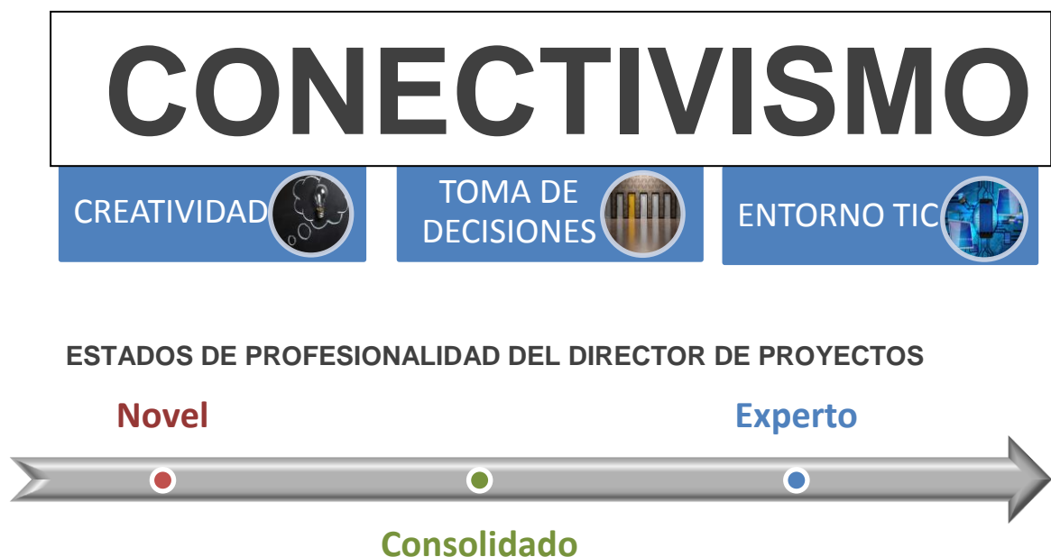
Figura 1: Mejora del perfil profesional del Director de Proyectos

En este nuevo marco, en el que las redes adquieren una importancia enorme en un entorno digital en rápida expansión, el Conectivismo establece que la formación ya no es una actividad que se realice a nivel individual, sino que consiste en el proceso de conectar nodos especializados o fuentes de información (Downes, 2012). Pasando a distribuirse a través de redes, por lo que se abre una vía alternativa a la establecida a nivel personal (Siemens, 2004).