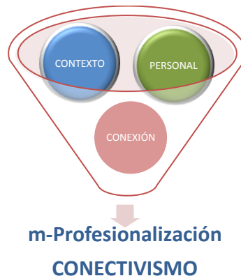
Figura 3: Control de factores para la profesionalización mediante empleo del móvil.