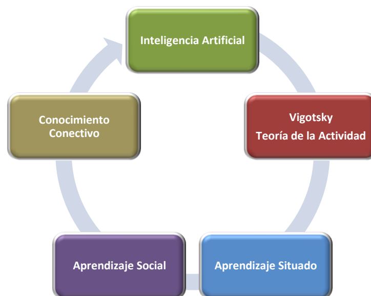
Figura 2: Influencias sobre el Conectivismo

La construcción de significado y la formación de conexiones entre comunidades de profesionales son algo importante para el Director de Proyectos (Clinton, Lee & Logan, 2011). Que ha de aprender a adaptarse en un entorno profesional cambiante y tener la capacidad de reconocer y ajustarse a esos cambios que se producen. Se ha de entender la formación como un proceso de auto-organización, llegando a ser capaz de formar conexiones entre fuentes de información para poder crear patrones de información útiles que le irán acompañando durante todo su ciclo de vida profesional.