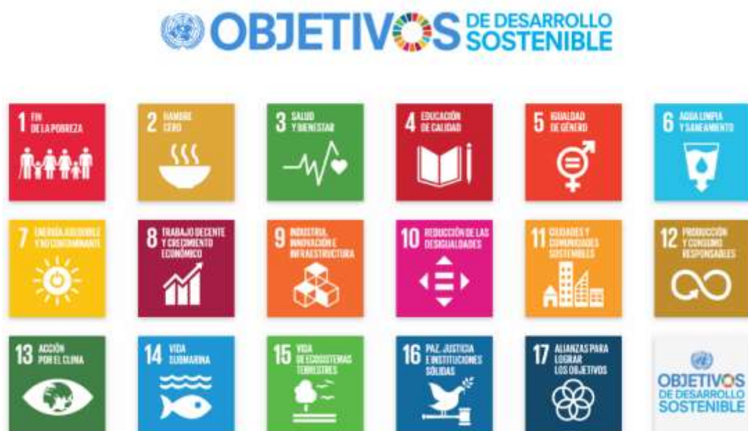
Figura 1. Objetivos de Desarrollo Sostenible.

Para el desarrollo de los ODS resulta fundamental integrar a todos los actores: administraciones públicas, empresas, organizaciones no gubernamentales, etc. (Annan-Diab & Molinari, 2017; Dlouhá & Pospíšilová, 2018). Del mismo modo, para el cumplimiento de los ODS requiere un abordaje de carácter multidisciplinar (Annan-Diab & Molinari, 2017). El carácter eminentemente pluridisciplinar que tradicionalmente ha tenido el Área de Proyectos