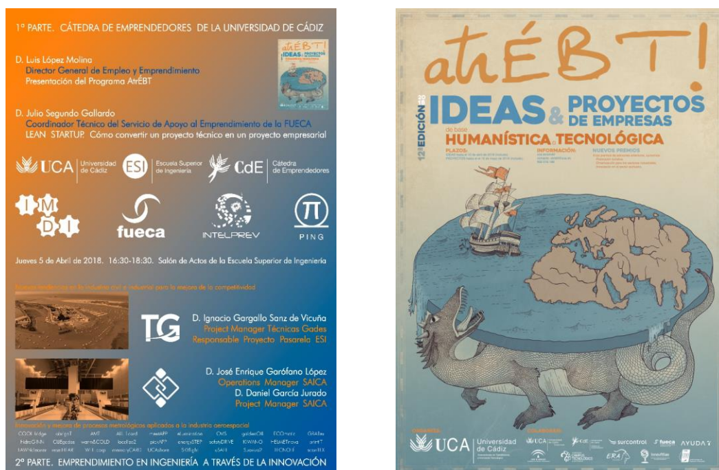
Figura 2: Carteles: -Seminario de Emprendimiento e Innovación en Ingeniería - 5/4/2018- -Programa atréBT! 2018 - Ideas para Empresas de Base Tecnológica-

Los casos prácticos, una vez tienen el visto bueno de los docentes, que actúan con el rol de patrocinador, tienen que abordar una serie de puntos: proposición de valor, viabilidad técnica, económica y contextual, tanto legal como medioambiental, formulación del proyecto, gobernanza, organización del trabajo, definición técnica, control de cambios y gestión de riesgos y oportunidades. Durante el curso, con objeto de involucrar activamente a los estudiantes, se programa una jornada de emprendimiento en ingeniería a través de la innovación, como muestra la Figura 2, para la que se invita a la dirección general de empleo y emprendimiento de la UCA y a la Cátedra de Emprendedores, los cuales presentan el programa atréBT! 2018, así como a 2 empresas del entorno, constituidas por egresados de la UCA, que emprenden, innovan y aplican principios en dirección de proyectos para el desarrollo de sus líneas de negocio, en los sectores de las ingeniería civil, industrial y aeroespacial. La jornada pretende, además, motivar a los estudiantes para que sus casos prácticos participen en atréBT! 2018.