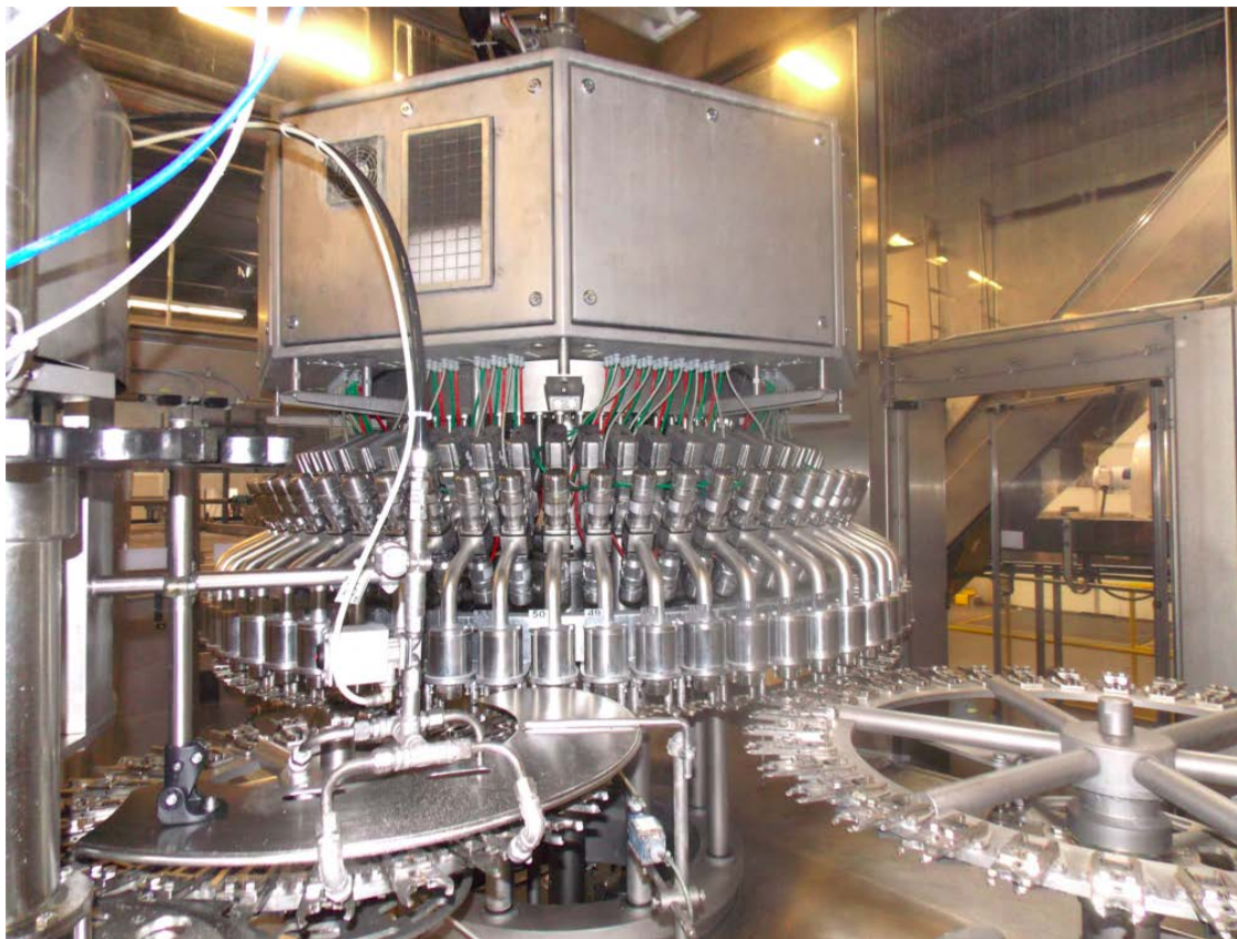
Figura 3: Llenadora Krones

Máquina rotativa compuesta por diversas partes móviles.