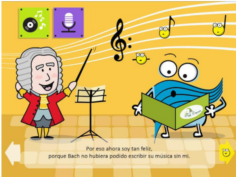
Figura 2. Ejemplo de una de las pantallas de la app “El Pentagrama”

esenciales para introducirnos en el mundo de la música. Además, cada pantalla dispone de varios iconos que se mueven o se realzan para que, cuando presiones sobre ellos, suene una nota (en este nivel solo aparecen las notas La y Do). De este modo, el niño escucha estas notas y aprende a cantarlas. Una vez transcurridas las 5 páginas, la aplicación nos lleva a dos juegos: uno en el que suenan notas y hay que acertarlas, y otro de emparejar cartas según los sonidos. Cuando se acierta se obtiene un diapasón como premio y si se falla se pierde un diapasón.