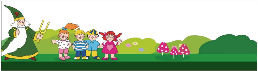
Figura 1. Protagonistas del cuento del Mago Diapasón

Mediante las canciones que se emplean, los niños sienten la necesidad de introducirse dentro de la música, bien sea mediante gestos o palmas. Además, en estas canciones también se cantan de manera lateral las notas, con la finalidad de que se vaya reconociendo su afinación. Estas canciones son simples y están compuestas especialmente para ser agradables y fáciles de aprender.