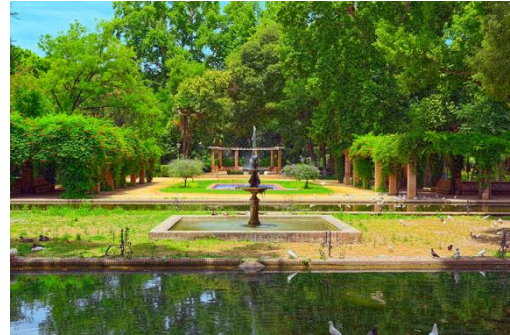
Glorieta de los Lotos

También el hecho de que la ciudad de Sevilla fuera uno de los puertos de entrada de la música 'rock' a España gracias a la llegada de militares de las bases de Morón y Rota que se reunían a tocar sus temas en la 'Glorieta de los Lotos' del Parque de María Luisa me animó a adentrarme en esta aventura cultural e histórica (1).