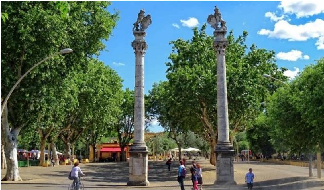
Alameda de Hércules