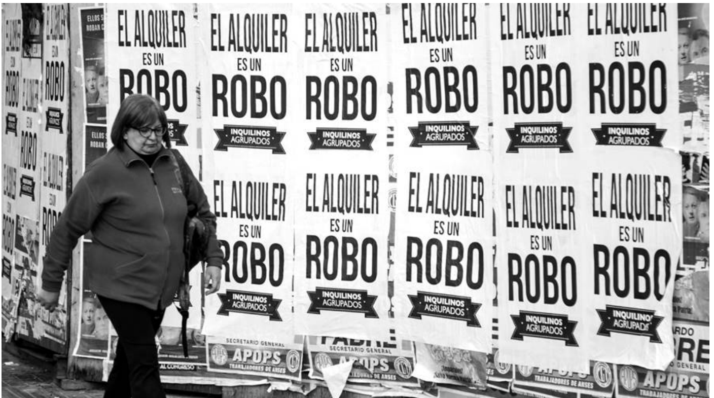
Figura 3. Campaña por la Ley Nacional de Alquileres.

liarias no aceptan las garantías bancarias que el programa ofrece y los precios indicativos de “Alquilar se puede” están muy por debajo de los valores de mercado (cfr. Vera Belli, 2016, pp. 278-279).