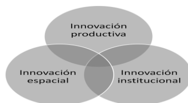
ILUSTRACIÓN 1. LA TRIPLE VISIÓN DE LA INNOVACIÓN UNIVERSITARIA

de mejora que supone un cambio novedoso de los planteamientos y métodos de su docencia". El fomento de la innovación docente es una de las principales vías, no la única, con las que las Universidades están fomentando la mejora de su calidad docente y a la vez están respondiendo a los nuevos cambios del contexto universitario.