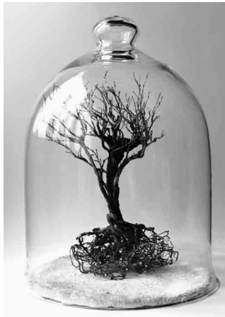
Figura 3 · María Ortega Estepa (2013). Nuevas constelaciones . Neilson Gallery.