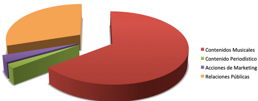
Figura 2. Emisión de contenido de la cuenta oficial en Twitter de India Martínez.

La artista cordobesa India Martínez ha publicado en total 566 tweets, de los cuales 366 son de contenidos musicales, 12 de contenidos periodísticos, 18 de acciones de Marketing, y 170 de Relaciones Públicas.