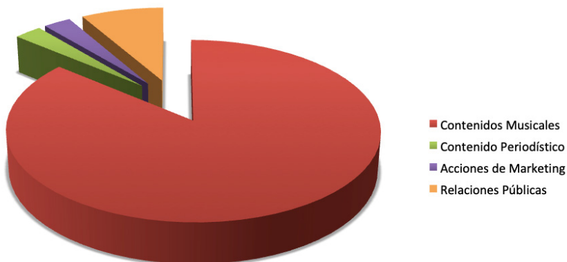
Figura 4. Emisión de contenido de la cuenta oficial en Twitter de Niña Pastori.

La artista Niña Pastori, de la disciplina flamenca de cante, ha publicado en total 72 tweets, de los cuales 62 son de contenidos musicales, 2 de contenidos relacionados con el periodismo, 2 de acciones de Marketing, y 6 de Relaciones Públicas.