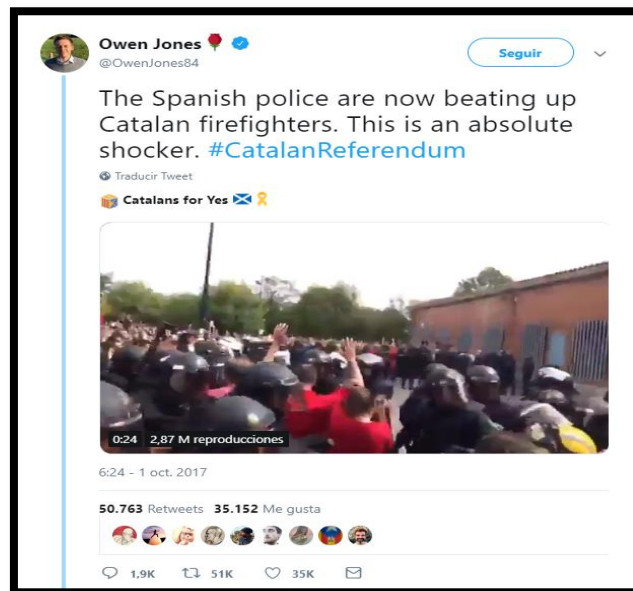
Imagen 3. Tweet de @OwenJones84. Fecha: 01/10/2017.

Owen Jones es un reconocido periodista de izquierdas que trabaja para medios tan importantes como The Guardian, Le Monde diplomatique, BBC o the Independent. Sin embargo, no siguió los principios éticos de la profesión cuando publicó una noticia falsa en su cuenta de Twitter. Se trata de un vídeo donde se observa a la Policía Nacional agrediendo a los bomberos catalanes el 1-O. El vídeo es real, pero pertenece a una huelga que tuvo lugar en 2012. En muy poco tiempo el tweet se hizo muy viral, llegando a la cifra de 50.000 retweets , una noticia real pero que pertenecía a otro año y que un periodista prestigioso ni siquiera rectificó ni eliminó. Este tweet consiguió casi 2.000 respuestas de británicos, alemanes, estadounidenses y gente de otros países.