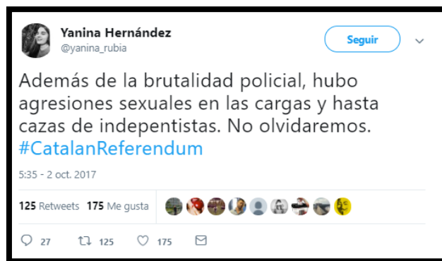
Imagen 22. Tweet de @yanina_rubia. Fecha: 02/10/2017.

Las agresiones policiales del 1-O son una realidad innegable. La Generalitat mantuvo la cifra de 893 heridos, mientras que el 1-O, el Ministerio de Interior afirmaba que la cifra de guardias civiles y policías heridos era de 39. Al día siguiente, Interior incrementó la cifra de Fuerzas y Cuerpos de Seguridad del Estado a 431.