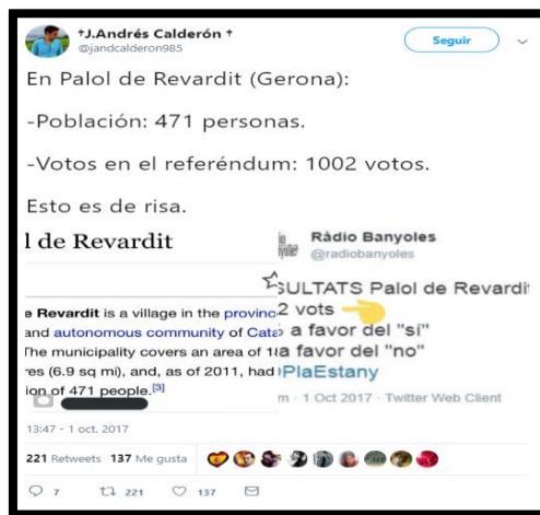
Imagen 21. Tweet de @jandcalderon985. Fecha: 01/10/2017.

Pocas horas antes de dar comienzo a la celebración de la consulta, el Govern anunció el censo universal, lo que significaba que los 5,3 millones de catalanes convocados podían votar en cualquier colegio de su zona. El Govern pensó muy bien qué podían hacer para ganar terreno a la actuación del Gobierno, por ello pusieron a la disposición de los catalanes la posibilidad de poder ir a otro colegio a votar si el colegio electoral que les pertenecía se encontraba cerrado o precintado por la Policía Nacional. Andrés Calderón es el autor de esta fake new que tanto se difundió en los medios nacionales. Calderón es un joven afiliado a Vox que se percató de la incoherencia de los resultados en un pequeño pueblo de Gerona.