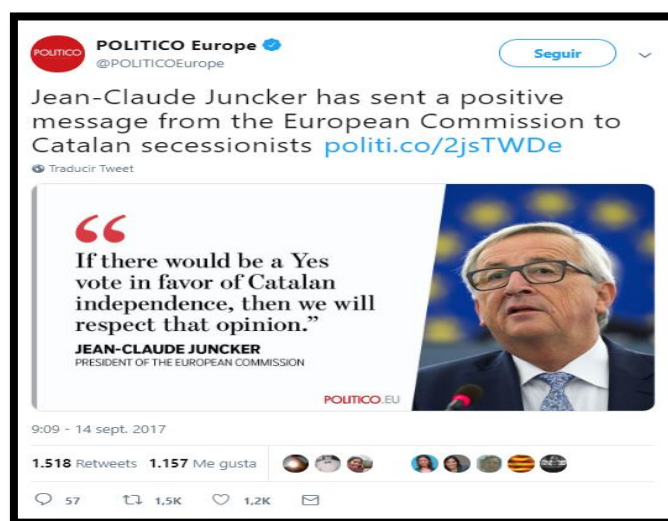
Imagen 17. Tweet de @PoliticoEurope. Fecha: 14/09/2017.

Politico Europe es la versión europea de Politico, la compañía periodística sobre política americana fundada en 2007. Politico Europe cometió un error gravísimo al dar a entender en su cuenta de Twitter que el Presidente de la Comisión Europea Jean-Claude Juncker apoyaba a los independentistas. En una entrevista al Presidente sobre lo que pasaría el 1-O en Cataluña, se le preguntó si apoyaría el resultado del referéndum fuese el que fuese. Juncker, determinante en su respuesta, declaró que la decisión de la Constitución española debía ser respetada y que el resultado del referéndum podría ser