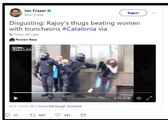
Imagen 13. Tweet de @Ian_Fraser. Fecha: 01/10/2017.