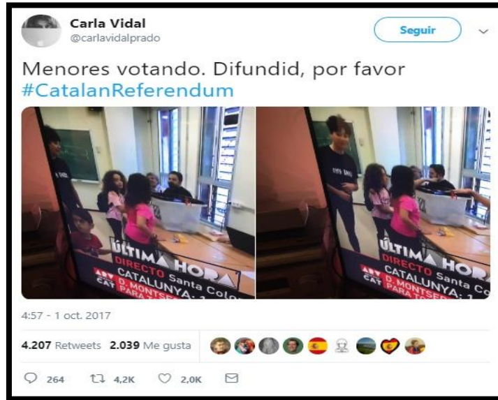
Imagen 20. Tweet de @carlavidalprado. Fecha: 01/10/2017.

A pesar de que el reglamento del artículo 86 de la Ley Orgánica 2/2011 del Régimen Electoral determine que únicamente el elector o el Presidente puede introducir su voto en la urna, en España es común que los hijos introduzcan la papeleta de sus padres en las urnas porque les hace ilusión o gracia. Con más de 4.000 retweets , esta joven publica una captura del programa de Al Rojo Vivo donde se observan a dos niñas introduciendo el voto en una urna en un colegio electoral el 1-O.