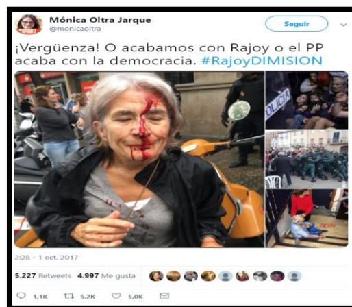
Imagen 16. Tweet de @Monicaoltra. Fecha: 01/10/2017.