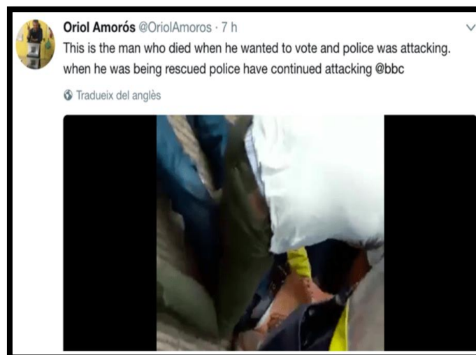
Imagen 9. Tweet de @OriolAmoros. Fecha: 02/10/2017.

Las redes sociales es un lugar donde cualquiera puede publicar informaciones sin ningún tipo de filtro. Pero si eres un individuo que pertenece a la esfera política debes tener cuidado con esto. Es lo que le pasó a Oriol Amorós, secretario de Igualdad,