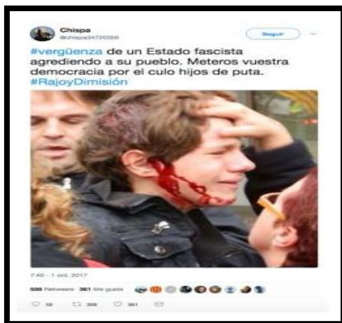
Imagen 12. Tweet de @Chispa34720586. Fecha: 01/10/2017.

La fotografía de un niño herido en la cabeza tras una carga policial de los Mossos fue difundida el 1-0 en Twitter por distintas cuentas. Con más de 300 retweets , esta imagen un chico con una herida importante y con la cara ensangrentada no pertenecía al 1-0, sino a un incidente ocurrido el 14 de noviembre del 2012 en Tarragona. La noticia real impactó en su momento y fue publicada por todos los medios nacionales. Sin embargo, el 1-0 reapareció en Twitter con otra fecha y otras circunstancias. El País y Maldito Bulo lo desmintieron, a pesar de que aún sigue circulando esta noticia falsa por Twitter.