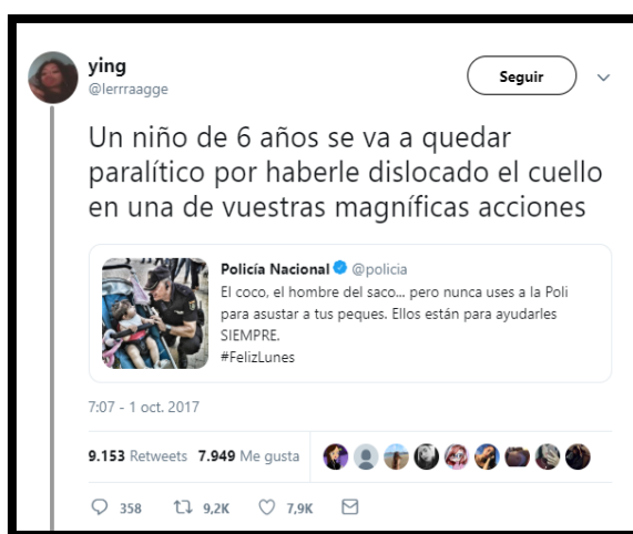
Imagen 1. Tweet de @Ierrragge. Fecha: 01/10/2017.