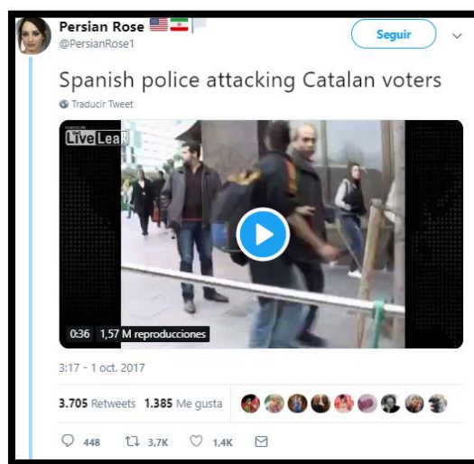
Imagen 24. Tweet de @Persianrose1. Fecha: 01/10/2017.

Persian Rose es una cuenta de origen norteamericana e iraní que se dedica a publicar tweets que se convierten en virales en la mayoría de los casos. Tiene más de 33.000 seguidores y el 1-O difundió una noticia falsa. Se trata de un vídeo donde se observa a la Policía agredir brutalmente a un grupo de ciudadanos. No pertenecía al 1-O, sino a la huelga general del 14N en 2012. La mayoría de las respuestas que consiguió el tweet afirmaban la falsedad de la publicación y pedían a la autora que lo eliminase para evitar desinformar a los demás. Persian Rose no solo no eliminó el tweet sino que tampoco se retractó, el tweet alcanzó la cifra de 3.705 retweets y sigue circulando por la red social.