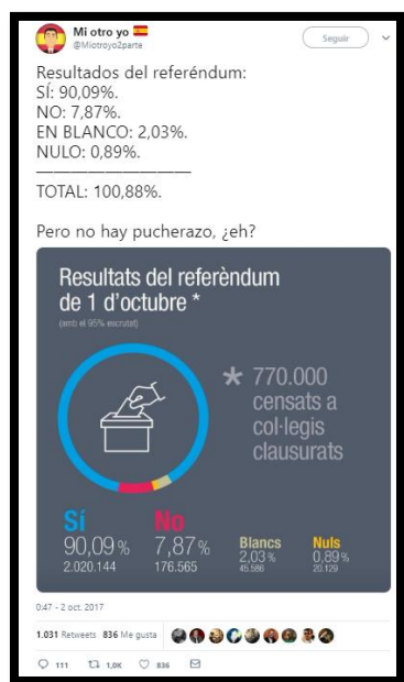
Imagen 8. Tweet de @Miotroyo2parte. Fecha: 02/10/2017.

CASO PRÁCTICO 8:” RESULTADOS DEL REFERÉNDUM: SÍ: 90,09%. NO: 7,87%. EN BLANCO: 2,03%. NULO: 0,89%. ————— TOTAL: 100,88%. PERO NO HAY PUCHERAZO, ¿EH?”