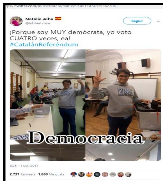
Imagen 18. Tweet de @InLibertatem.. Fecha: 01/10/2017.

La celebración del referéndum el 1-O fue ilegal, no estuvo organizada correctamente ni su resultado tiene validez legal alguno. La interrupción de las Fuerzas del Estado en los colegios electorales, las compras anónimas de las urnas, las agresiones policiales y el descontrol general no permitieron que la consulta se realizase de manera adecuada. Decenas de usuarios en Twitter se percataron de la irregularidad de la votación y favorecieron el desarrollo de las fake news .