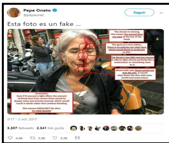
Imagen 10. Tweet de @pepeonet. Fecha: 01/10/2017.

Otro caso de periodistas que no siguen el código deontológico es el de Pepe Oneto, periodista español que ha sido galardonado con premios como la Antena de Oro de Televisión o el I Premio Santiago Castelo a la Trayectoria Periodística en 2016. Con un intento de desmentir la actuación de la Policía Nacional y sus cargas contra los catalanes que fueron a votar a I-O, Oneto publicó la imagen en Twitter de una mujer herida en la que se explicaba a través de pequeños bocadillos escritos en inglés que todo era un montaje.