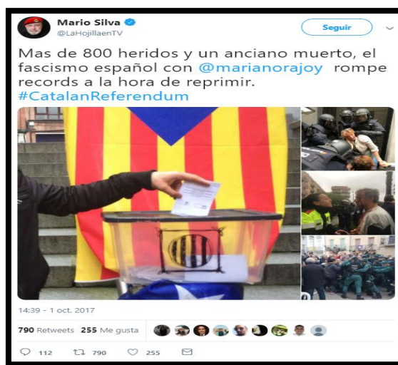
Imagen 23. Tweet de @LaHojillaenTV. Fecha: 01/10/2017.

El conflicto catalán tuvo tal repercusión internacional que un Miembro de la Asamblea Nacional Constituyente de Venezuela contribuyó a la desinformación sobre el 1-O. Mario Silva, político y también famoso presentador de televisión en Venezuela, publicó un tweet que alcanzó casi los 800 retweets en tiempo récord. En el tweet hacía mención al fallecimiento de un anciano por las cargas policiales, una muerte falsa que el venezolano jamás llegó a rectificar.