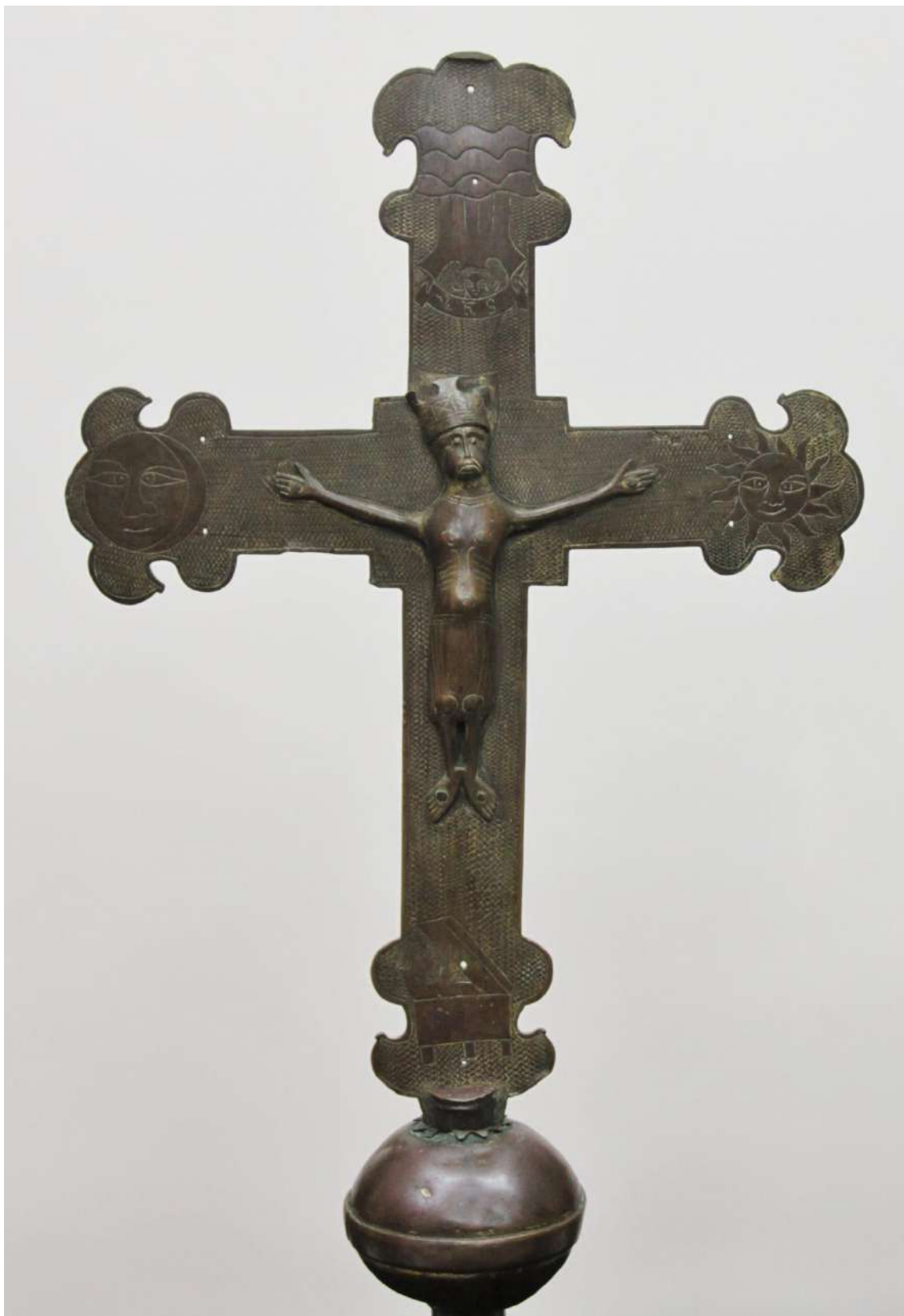
Fig. 3. Cruz procesional, proc. Robredarcas, fin. S. XII, Museo Diocesano de Sigüenza,