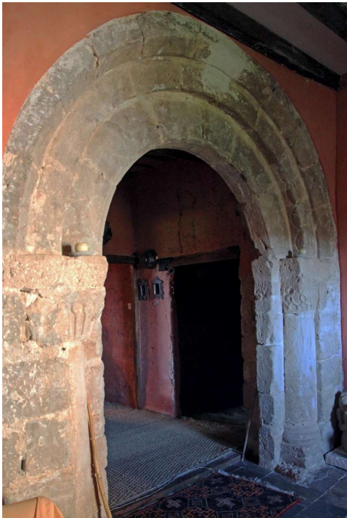
Fig. 1. Portada de la antigua iglesia de El Peral, fin. S. XII - pp. S. XIII, casa del santero de la ermita de Nuestra Señora del Peral de Dulzura, Budia.