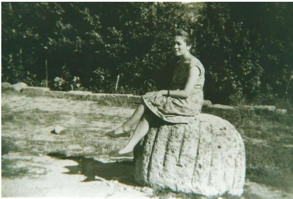
Fig. 4. Pila bautismal (desaparecida), proc. Rueña, fin. S. XII - pp. S, XIII, plaza de la iglesia, Olmeda del Extremo, © Rodolfo Aguado (1964).