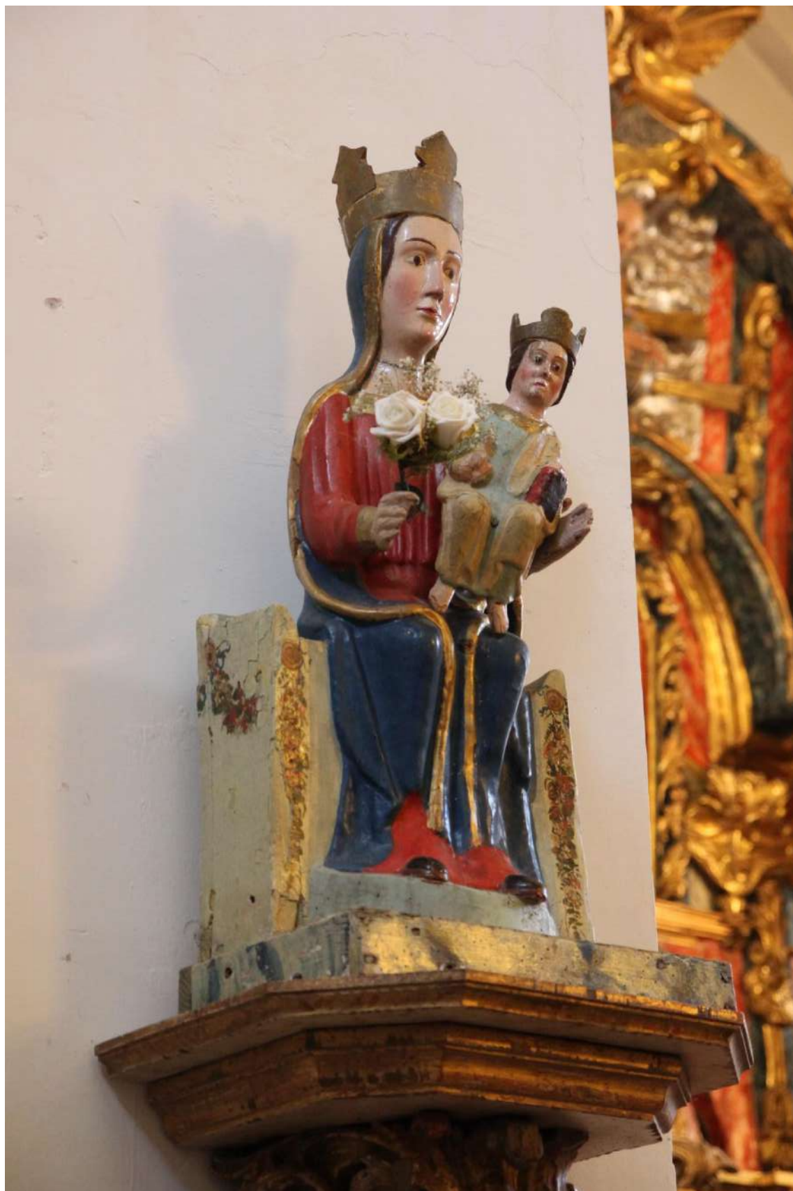
Fig. 2. Virgen de Aranz, proc. Aranz, fin. S. XII - pp. S. XIII, iglesia de Santa Marina, El Sotillo, © José Arturo Salgado (2018).