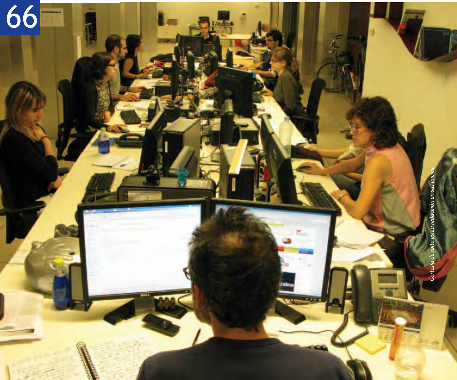
La redacción en sus inicios.