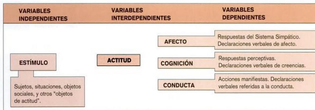
Figura 1. Modelo Actitudinal Tripartito.

Fuente: Martín, M. J. (2004). Violencia juvenil exogrupal. Hacia la construcción de un modelo causal . Madrid: Ministerio de Educación, Cultura y Deporte. Área de Educación, p. 71.