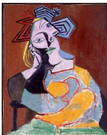
Fig. 3. Mujer sentada acodada , Picasso, 1939.