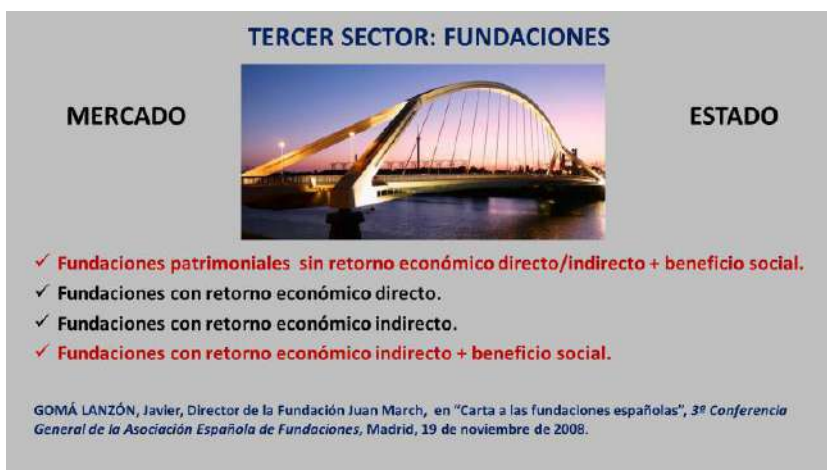
Fig. 1. Imagen que sintetiza la presentación de Javier Gomá Lanzón, director de la Fundación Juan March en «Carta a las fundaciones españolas», 3ª Conferencia General de la Asociación Española de Fundaciones, Madrid, 19 de noviembre de 2008.