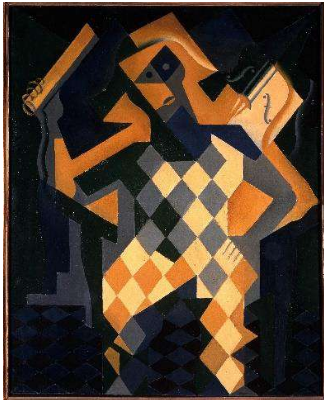
Fig. 4. Arlequín con violín , Juan Gris, 1919.