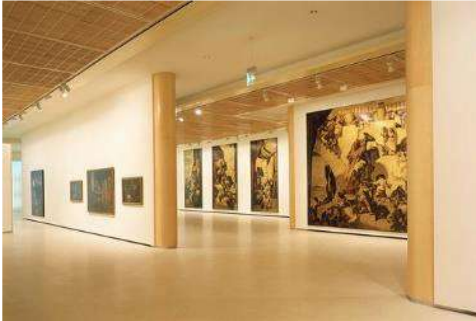
Fig. 5. “Colección de colecciones”: Paneles de Sert para el comedor del Hotel Astoria de Nueva York , 1931, hoy en la Sala de Arte de la Fundación Banco Santander. Ciudad Financiera, Boadilla, Madrid.