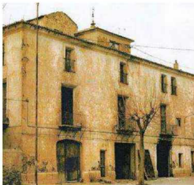
FIG. 3. Palacio Episcopal de Cox (desaparecido).