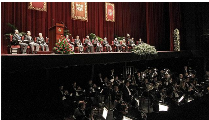
Foto 9. La Banda Sinfónica en el Pregón de la Semana Santa

Recuperada de: https://sevilla.abc.es/pasionensevilla/actualidad/noticias/pregon-marchas.html