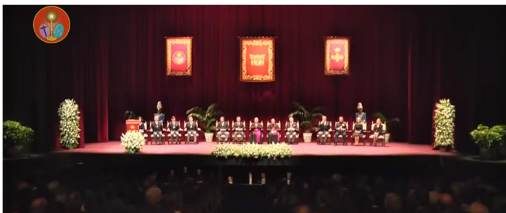
Foto 10. Escenario Pregón 2019 con sus autoridades

Del Consejo siempre acuden las mismas personalidades: el Presidente, el cual se sienta en la presidencia, y el Vicepresidente, el Tesorero y el Secretario, que se sientan junto al pregonero. Estos tres son los cargos más importantes inmediatamente después del presidente.