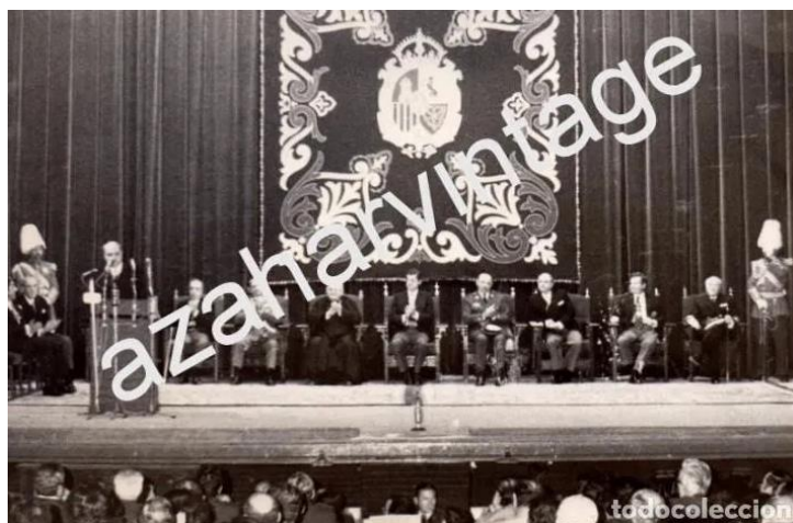
Foto 11. Pregón del año 1977

La disposición de estos elementos en el escenario, así como la cantidad de ellos, es algo que sí ha variado a lo largo de la historia. Destaca siempre el uso de tapices por encima de las banderas de nuestro país o de nuestra ciudad, pero estos tapices han ido variando para adaptarse o bien a la moda presente en esa época, o a las exigencias y gustos del responsable de protocolo encargado de organizar dicho año el Pregón de la Semana Santa. A continuación, podemos ver dos claros ejemplos de ello: