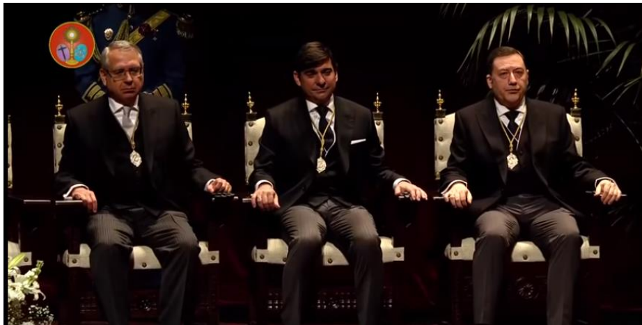
Foto 6. Miembros del Consejo en el Pregón de 2019

(estos tres últimos no fueron mencionados en el saludo de la pregonera, como suele ocurrir)