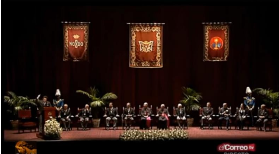
Foto 1. Escenario del Pregón del año 2016

En el fondo del escenario vemos cuatro macetones de palmeras, cuyas macetas destacan por ser de cerámica, un elemento decorativo característico de nuestra ciudad. Desde la época pre-cristiana las palmeras se consideran como un símbolo de victoria, y que los primeros cristianos tomaron igualmente como “símbolo de la victoria de los fieles sobre los enemigos del alma”.