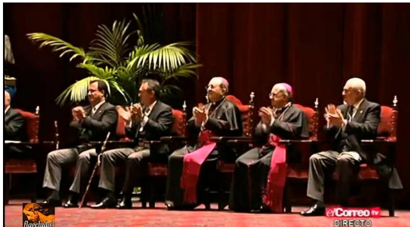
Foto 3. Presidencia del Pregón de 2016

(estos tres últimos no son mencionados en el saludo uno por uno como ocurre con los anteriores cargos, aunque los engloba mencionando a la Junta Superior del Consejo)