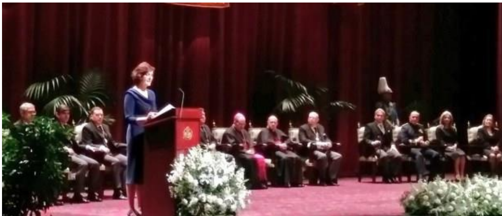
Foto 7. Pregón Semana Santa 2019

Podemos apreciar cómo los tratamientos en el saludo de la pregonera no siguen la norma oficial de tratamientos, ya que solo aplica los tratamientos correctos para el Arzobispo y el Alcalde, pero sin embargo no lo hace para el resto de las autoridades, nombrándolos simplemente con un “señor” (o “señora”) antes de mencionar su cargo.