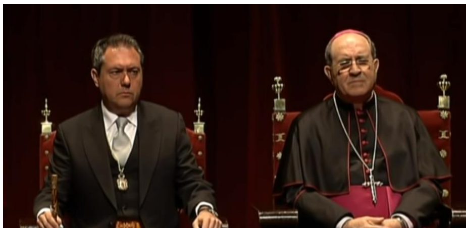
Foto 2. Arzobispo y Alcalde en el Pregón de 2016