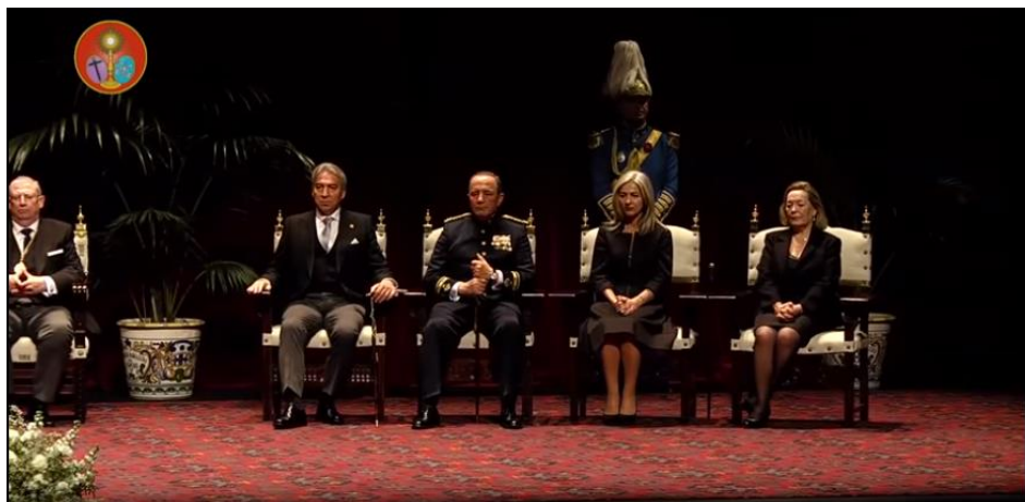
Foto 5. Autoridades en el Pregón de 2019

En cuanto al bastón de mando, respecto al Pregón anteriormente analizado, del año 2016 vemos que hay una persona que esta vez no lo porta: la Consejera de Cultura de la Junta de Andalucía. En 2016, en el lugar de esta se encontraba la Delegada del Gobierno de la Junta de Andalucía en Sevilla, la cual sí portaba dicho elemento protocolario símbolo de autoridad.