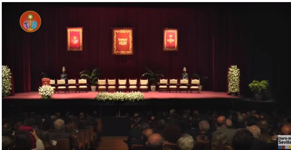
Foto 4. Escenario del Pregón de 2019

El cambio más significativo lo encontramos en las sillas. Estas han cambiado de un color burdeos oscuro, que provocaba una simplicidad y oscuridad, a un color beige o amarillo claro, que da una sensación de elegancia, además de distinguirse más del escenario. En cuanto a las sillas se puede apreciar otro cambio, y es la unificación de todas en cuanto a altura y tamaño. Si anteriormente veíamos que la silla del Arzobispo era ligeramente mayor, en este año 2019 vemos que ya no, que esta no sobresale de las demás.