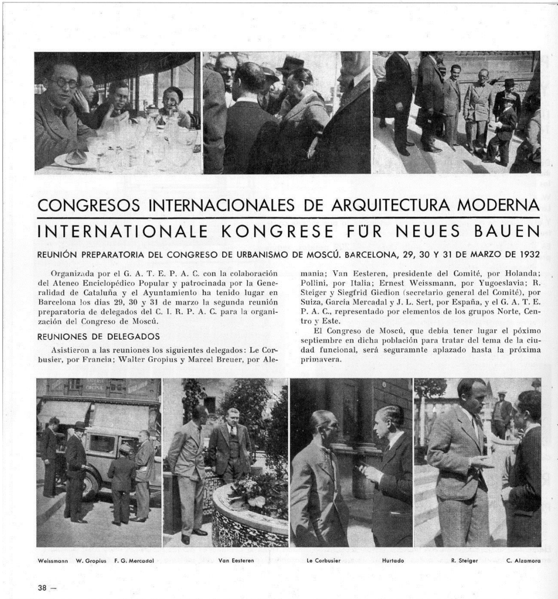
Fig. 1. Primera página del reportaje dedicado a la reunión preparatoria del Congreso de Urbanismo de Moscú, GATEPAC, AC: Documentos de Actividad Contemporánea nº 5, 1932, dominio público.

la actividad del grupo, siendo imposible llevar a cabo nuevas propuestas urbanísticas o continuar las ya iniciadas sin el apoyo institucional.