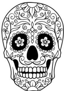
Dibujo de calavera mexicana para colorear

3) Fase preventiva. Actividad 3: Trabajamos con la película Coco .