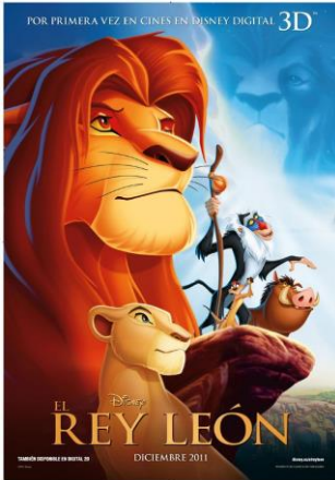
Película El Rey León de Disney (1994)

1) Fase preventiva. Actividad 2: Trabajamos con la película El Rey León .