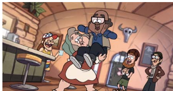
Figura 5. Imagen de la serie Gravity Falls.

Habiendo destacado este particular momento desconocido por la audiencia, hay que mencionar ahora los únicos personajes que entrarían dentro de la representación LGTB+, los personajes recurrentes del Sheriff Blubs y el agente Durland. Estos dos personajes son muy queridos dentro de la serie y los guionistas han ido dejando caer poco a poco que había algo más que una amistad y compañerismo entre ellos 8 . Sin embargo, a pesar de las continuas sospechas de los fans, no hubo un momento en el que todo se aclarase explícitamente hasta el último capítulo de la serie, Anormalgedón Parte 3: Recuperemos el Pueblo (2x20), contando Durland que están ambos locos de poder y de amor. De esta manera, el deseo de Alex Hirsch por tener un personaje homosexual en la serie ha podido cumplirse aunque no haya sido de manera oficial durante el transcurso de la serie. Así, Blubs y Durland se convierten en la primera pareja homosexual que aparece dentro de una serie animada de Disney.