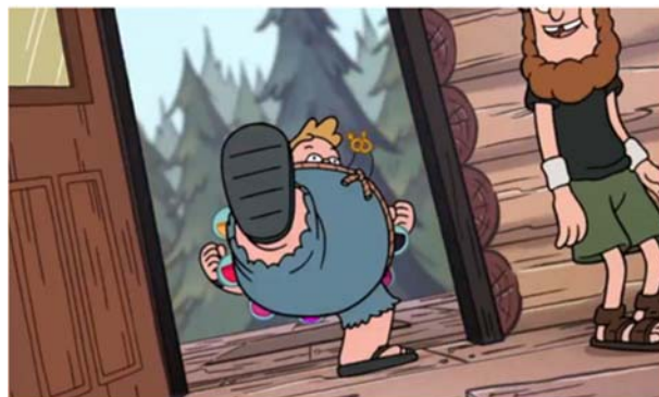
Figura 3. Imagen de la serie Gravity Falls.

Asimismo, durante esa misma escena, ocurre otro momento de censura en el que el Dios del Amor se acerca a una anciana llamada Meredith para lanzarle un hechizo de amor y demostrar su poder a los demás. En ese instante, el Dios del Amor le indica que su alma gemela se encuentra ahí mismo, señalando a un anciano que está en la barra comiendo, y seguidamente realiza su magia provocando que Meredith vaya corriendo hacia él cogiéndolo en brazos. En el storyboard original, su media naranja era otra mujer, por lo que se evitó la visualización en televisión de una pareja lesbiana de ancianas. Así se refleja en las dos figuras siguientes: