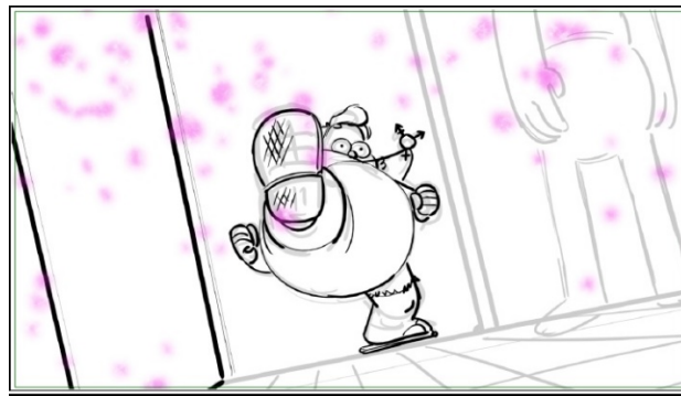
Figura 2. Storyboard de Sabrina Cotugno.

del Amor” para que se enamore de una chica y esta de él. En la primera aparición del Dios del Amor dentro de un restaurante, tiene lugar la primera censura respecto a los colgantes que este lleva, siendo los símbolos del género femenino y masculino. Sin embargo, tras desvelar una de las creadoras del storyboard los dibujos originales, se descubrió que el símbolo que en principio se iba a representar era el símbolo transgénero, compuesto por el símbolo del género femenino, el masculino y una combinación de ambos, tal como se muestra en las siguientes figuras: