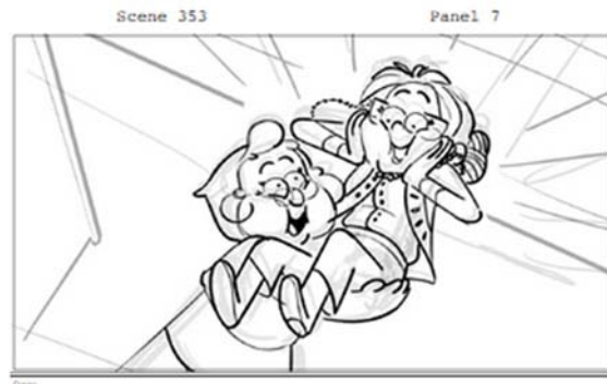
Figura 4. Storyboard de Sabrina Cotugno.