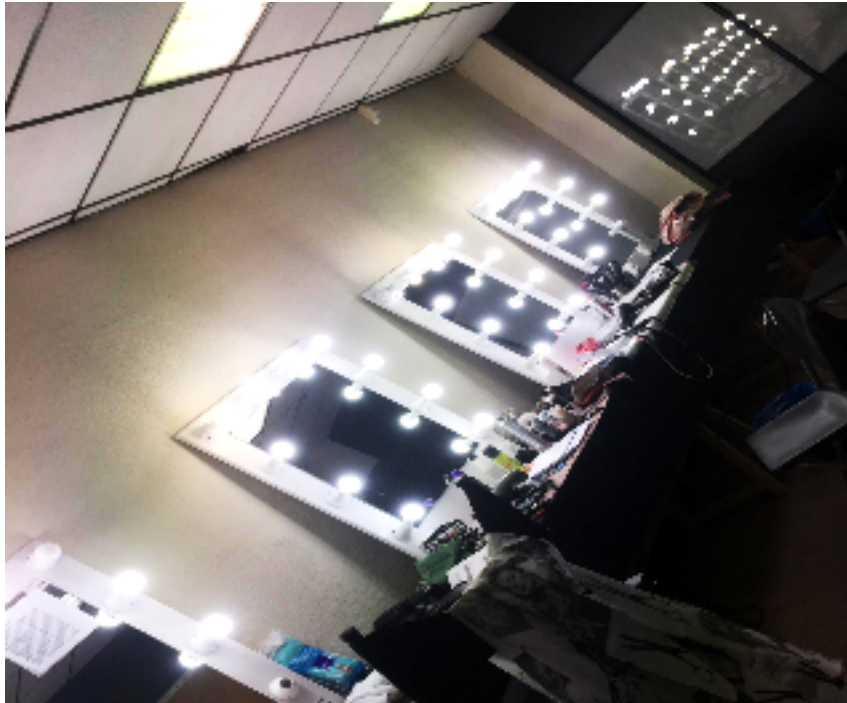
Fotografía realizada en el lugar de la entrevista: Rodaje de la serie “Desaparecidos” de T5