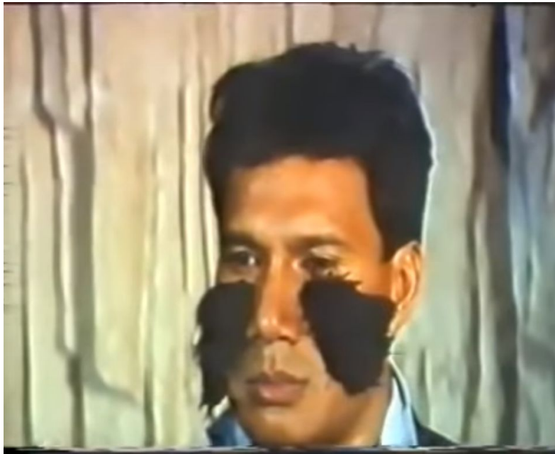
Imagen sacada de la película Werewolf (1987)

pésima (en cada fotograma se va añadiendo cachos de pelo de manera muy artificial) han creado que esta famosa escena pase de ser una película seria a una película de serie B y poco creíble (con matices humorísticos incluso).