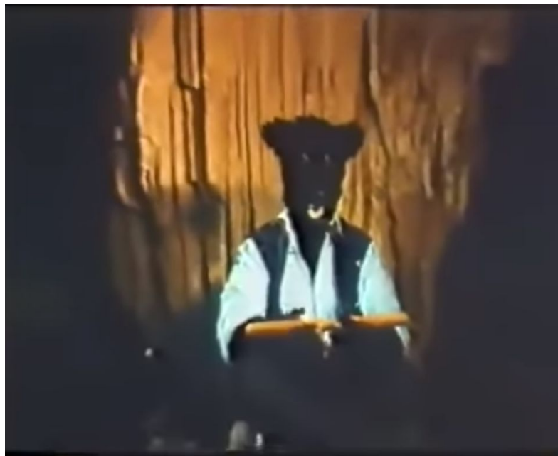
Imagen sacada de la película Werewolf (1987)

En la primera imagen podemos ver como no parece nada real el crecimiento del pelo en la cara del chico como tampoco el resultado final parece el de aparentemente un lobo.