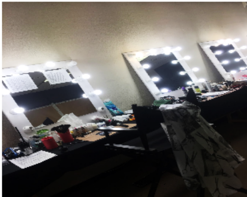
Fotografía realizada en el lugar de la entrevista: Rodaje de la serie “Desaparecidos” de T5

En esta última fotografía podemos observar algunos de los materiales que utilizan para el maquillaje de los actores/actrices y cómo crean una tabla (la que se ve en el espejo pegada) con el nombre de los distintos personajes y el tipo de maquillaje que deben hacerle.