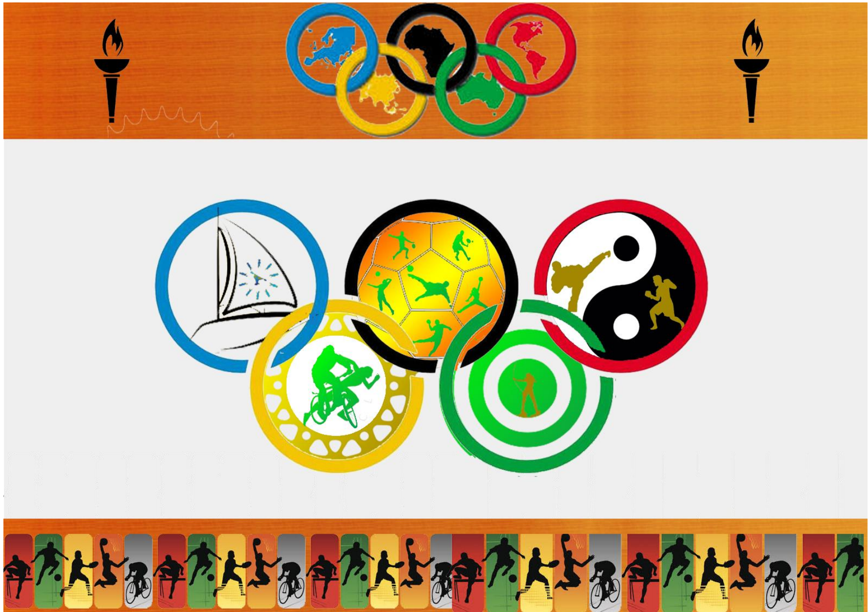
Ejemplo de mural para el Gimnasio del colegio