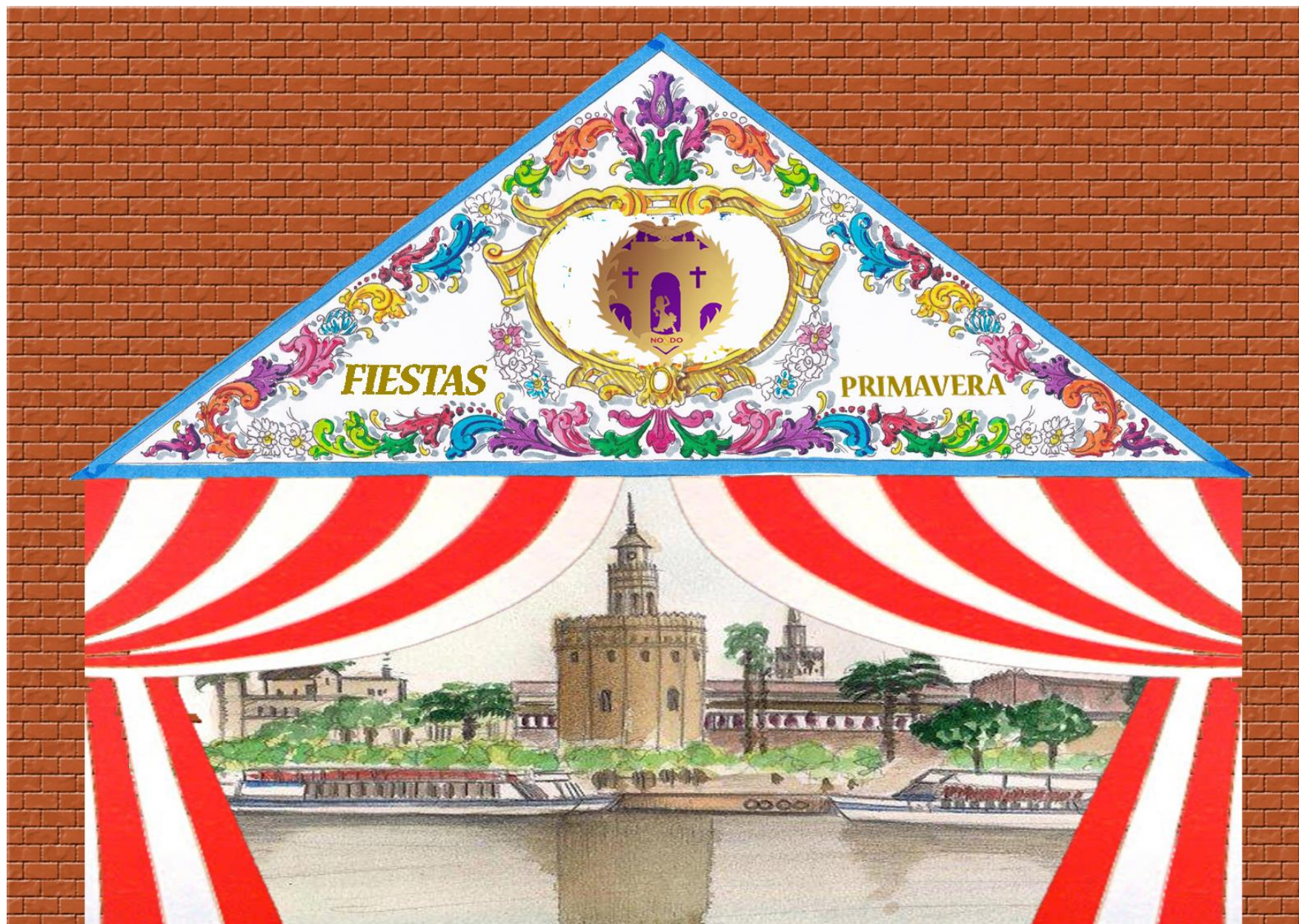
Ejemplo mural para la pared del patio del recreo