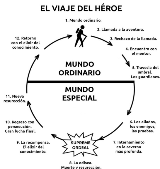
Figura 3 13

Sin embargo, este modelo en realidad no es más que una nueva versión del llamado viaje del héroe de Joseph Campbell, mencionado anteriormente en este trabajo, como se puede comprobar a continuación.