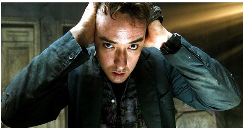
Imagen 11. Fotograma de la película 1408 (Mikael Håfström, 2007).

Retomando el género más misterioso, fantasmagórico, que utiliza el terror psicológico, hago especial mención del filme 1408 (Mikael Håfström, 2007). Durante este siglo se han retomado las novelas de Stephen King para adaptarlas al cine (una costumbre que se adquirió a finales de los setenta y durante los ochenta): La niebla ( The Mist , Frank Darabont, 2007), Carrie (Kimberly Peirce, 2013) o la sorprendente adaptación It (Andy Muschietti, 2017) que este año 2019 estrena su muy esperada segunda parte.