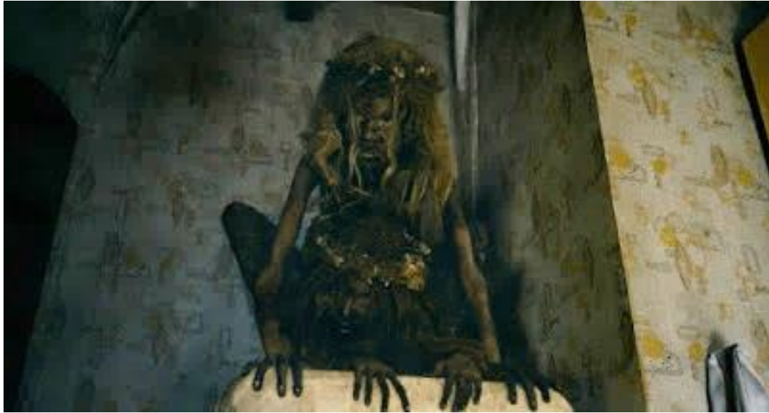
Imagen 1. Fotograma de la película Mamá ( Mama , Andrés Muschietti, 2013)

La figura del infante en estos filmes es un clásico a analizar, ya que puede combinar la inocencia con el engaño, la mentira de un ser que parece inofensivo y sin embargo puede ser el más terrorífico del planeta.