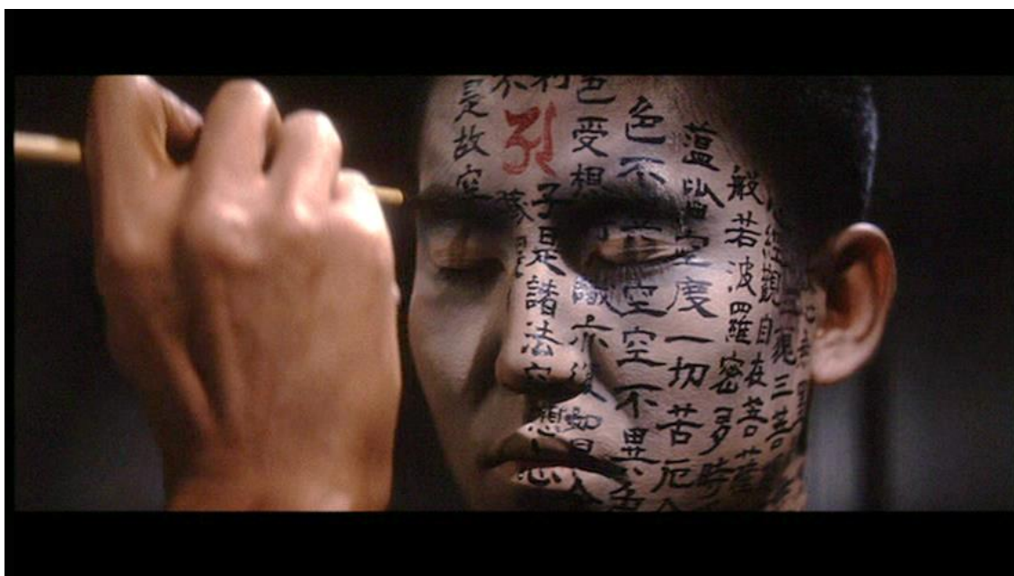
Imagen 8. Fotograma de la película El más allá ( Kwaidan , Masaki Kobayashi, 1964).