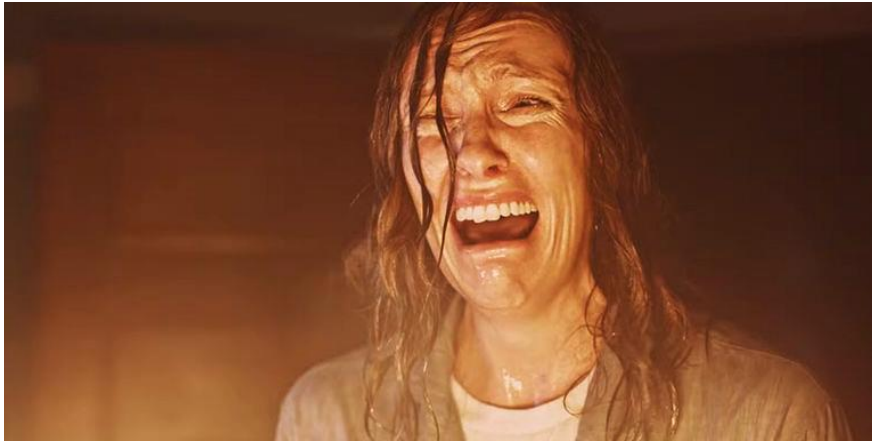
Imagen 13. Fotograma 1 de la película Hereditary (Ari Aster, 2018).