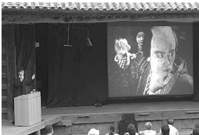
Imagen 7. Fotografía de un benshi .

Una de las cosas que más me llamó la atención investigando resultó ser la existencia de la figura del benshi : su trabajo consistía en narrar, explicar e incluso interpretar las películas que se proyectaban y venían del extranjero. Pero con el paso del tiempo lo comenzaron a hacer con películas de producción propias del país nipón. Se volvieron tan populares que se crearon escuelas para entrenarlos e incluso se volvían famosos, provocando que la gente fuera a ver la película no por el actor o actriz que apareciese, sino por el benshi que la explicaba e interpretaba.