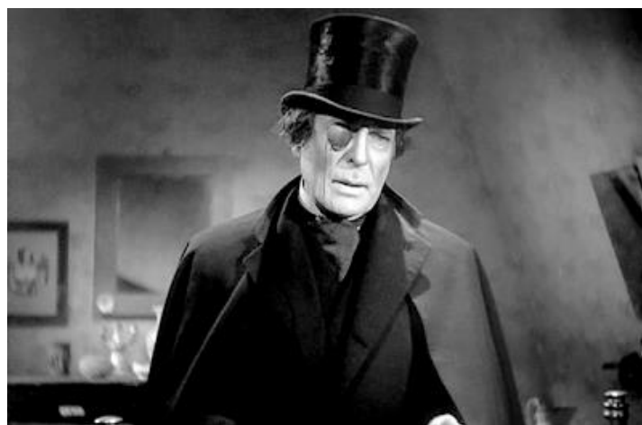
Imagen 4. Fotograma de la película La torre de los siete jorobados (Edgar Neville, 1944).

En España, llega a los cines La torre de los siete jorobados (Edgar Neville, 1944), primer filme del género influenciado por el cine gótico y el expresionismo alemán.