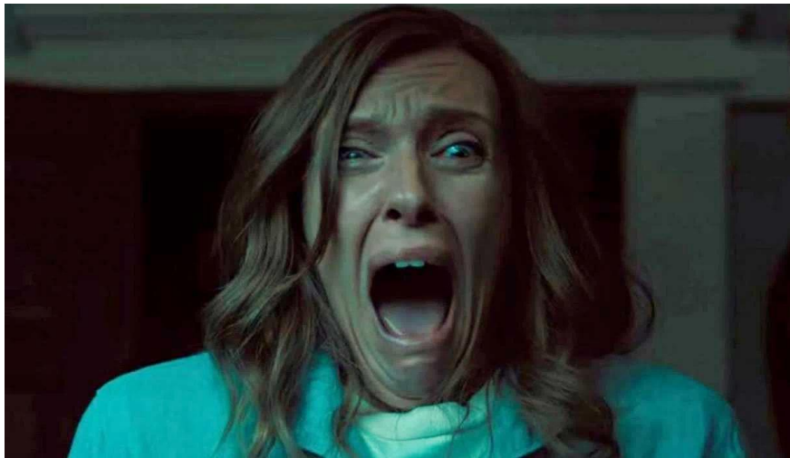
Imagen 14. Fotograma 2 de la película Hereditary (Ari Aster, 2018).