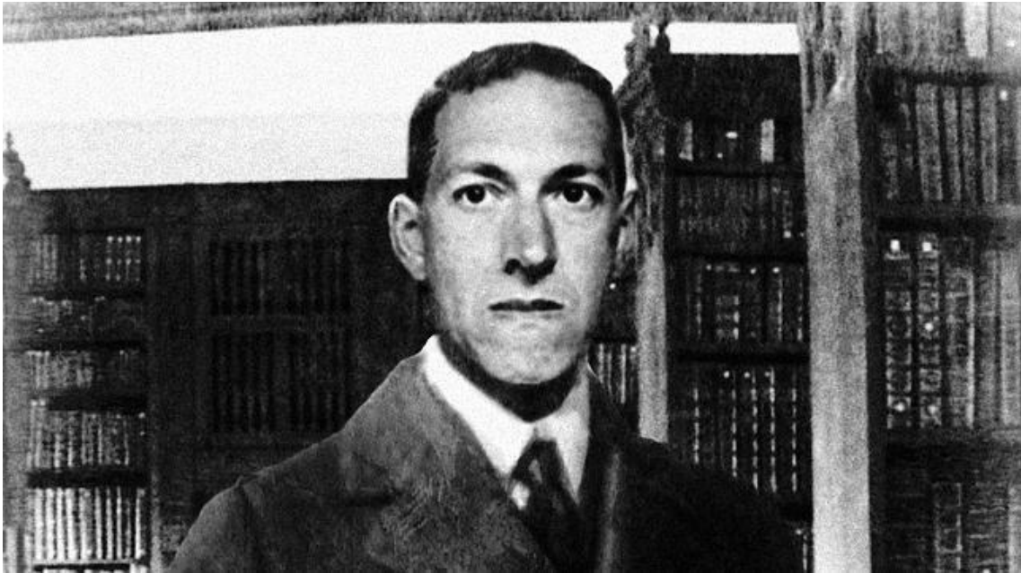
Imagen 2. Fotografía realizada a H.P. Lovecraft.

Podríamos nombrar a muchos autores del género del terror y el suspense en el mundo de las palabras sobre el papel, entre ellos dos de los más conocidos: Edgar Allan Poe y Lovecraft. Como dijo Lovecraft en la introducción de su libro El horror sobrenatural en la literatura : “La emoción más antigua y más intensa de la humanidad es el miedo, y el más antiguo y más intenso de los miedos es el miedo a lo desconocido”. No podía estar menos equivocado.