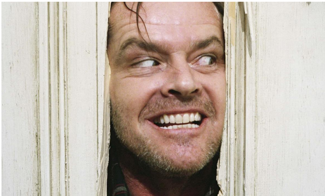
Imagen 6. Fotograma de la película El resplandor ( The Shining, Stanley Kubrick, 1980).

Se podría decir que los 80 fue un resurgir del género, su segunda época dorada. La libertad que produjeron los avances tecnológicos (como los efectos digitales) dio paso a la frescura de personajes e historias. Y en concreto fueron los años en los que se adaptaron varias de las novelas de Stephen King, comenzando así la década con El resplandor ( The Shining , Stanley Kubrick, 1980). ¿Quién no recuerda esa espectacular actuación de Jack Nicholson intentando abrir una puerta con un hacha?