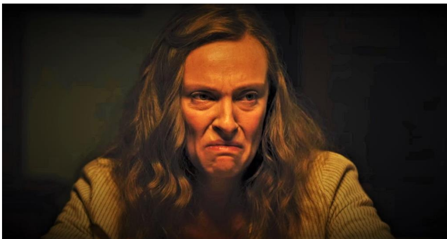
Imagen 15. Fotograma 3 de la película Hereditary (Ari Aster, 2018).