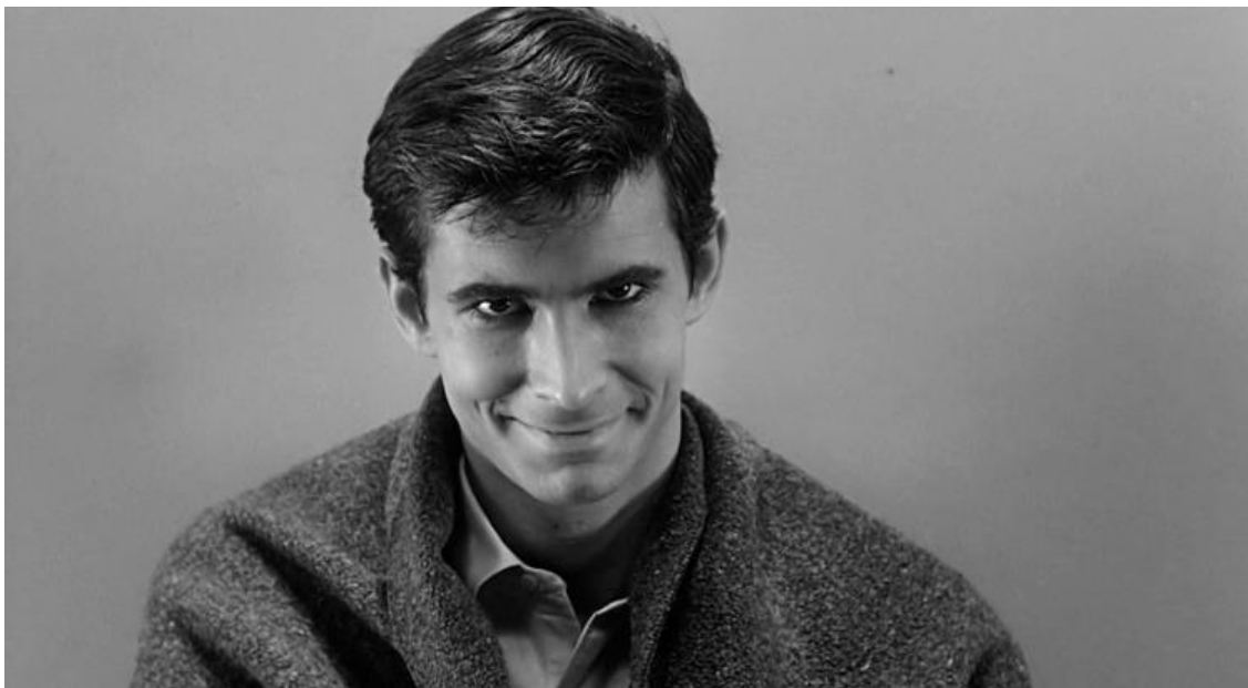
Imagen 5. Fotograma de la película Psicosis ( Psycho , Alfred Hitchcock, 1960).

En plena Guerra Fría y con la desconfianza a flor de piel entre los ciudadanos en Estados Unidos se empezaron a optar por temas más realistas, como, en este caso, el caso de una persona con un grado de psicopatía importante que acaba asesinando sin casi ni siquiera ser consciente de ello. Relatos basados en la realidad, sobre personas que nos podemos encontrar en cualquier momento de nuestras vidas. Algo bastante aterrador si lo pensamos bien.