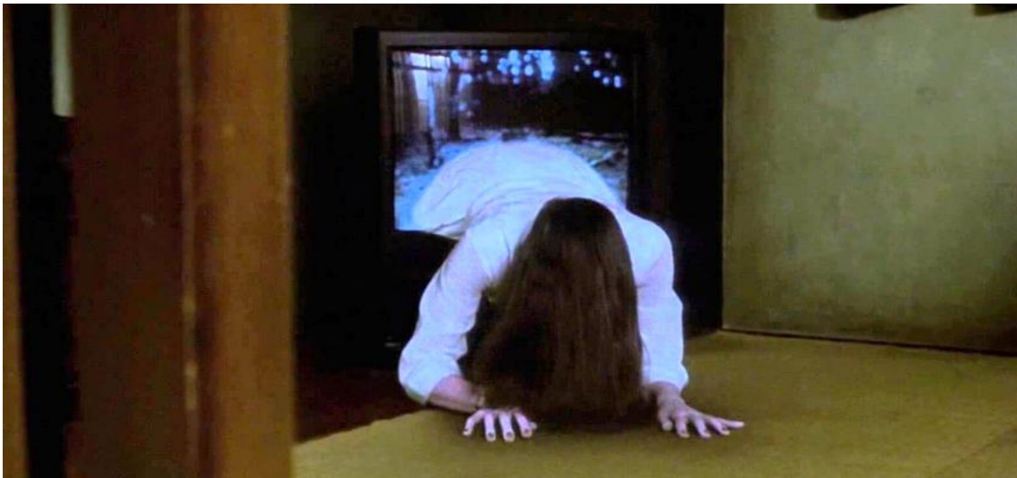
Imagen 9. Fotograma de la película The Ring (El círculo) ( Ringu , Hideo Nakata, 1998)

Creo que la fama de esta película en parte se debe a la actualización de la historia: casi todo el mundo tenía VHS en esa época y la simple idea de que rondara una cinta VHS maldita por todo el planeta atraía a la gente, ese morbo viral fue el que, personalmente pienso, le dio el “empujón” al filme. Aparece un personaje que pasa a ser parte del imaginario del género de terror internacional, el fantasma de la chica que sale de la televisión, Sadako.