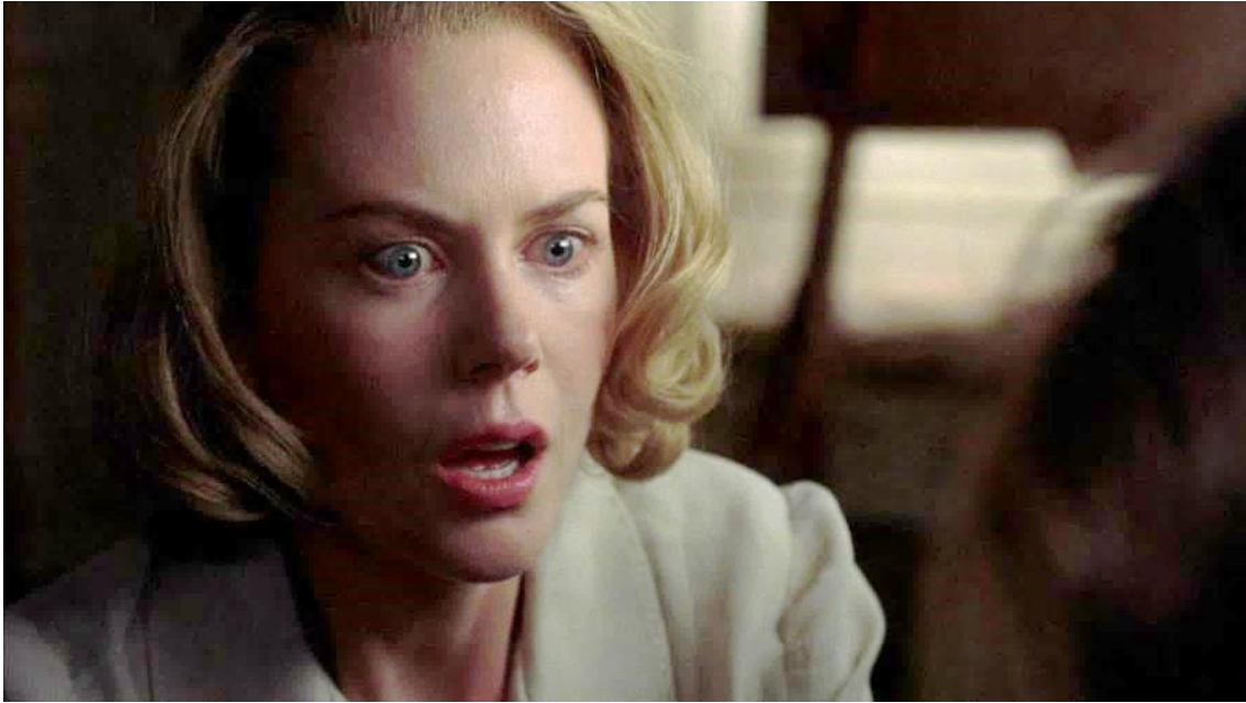
Imagen 10. Fotograma de la película Los Otros ( The Others , Alejandro Amenábar, 2001)

También recuerda a una película similar mucho más reciente con una historia parecida (aunque no llega a ser la maravilla que es Los Otros o El sexto sentido ): El secreto de Marrowbone (Sergio G. Sánchez, 2017). Las tres películas tratan los problemas psicológicos del ser humano y la propia negación ante la muerte.